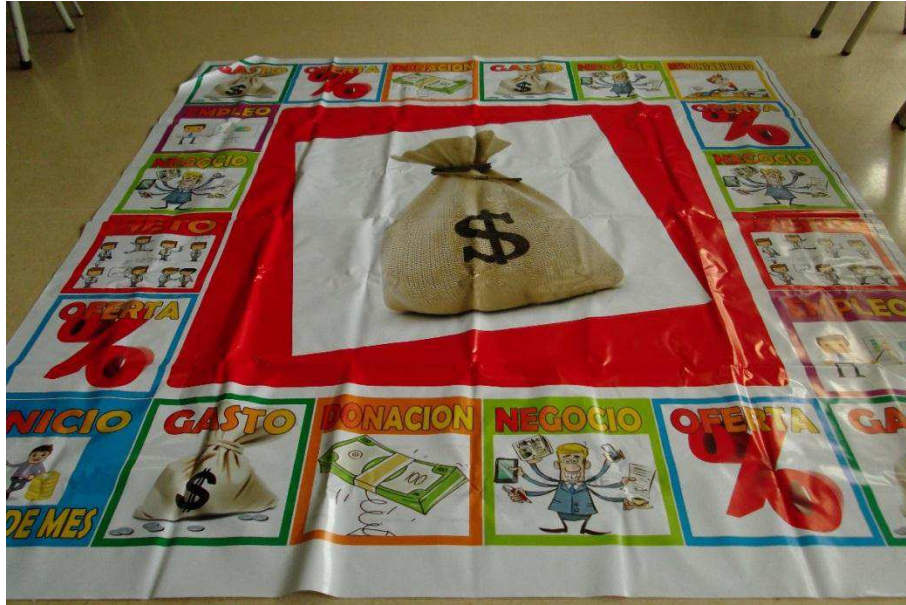
Imagen 1. Juego “Tablero contable”.

Descripción: Consiste en un juego en el cual los estudiantes deben surcar varios obstáculos o momentos de la vida financiera del sujeto (inversiones, gastos, oportunidades de invertir, entre otras) por un tablero de 20 casillas hasta lograr dar una vuelta completa y recibir su sueldo.