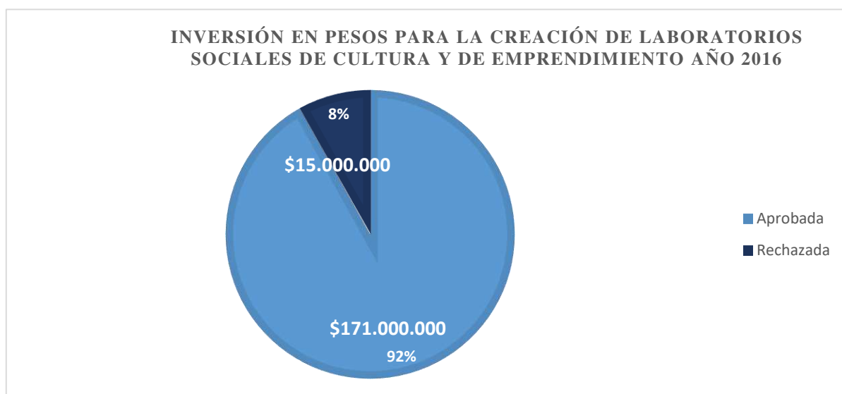
Figura 2. Inversión en pesos para la creación de laboratorios sociales de cultura y de emprendimiento 2016. Nota: autoría propia a partir del informe de gestión del MinCultura (2016).

Un factor relevante que identifica a este programa es la financiación que los laboratorios sociales de cultura y emprendimiento ofrecen a los representantes creativos, ya que está basada en dos modalidades; la financiación a corto plazo, cuyo vencimiento debe ser inferior a un año y la financiación a largo plazo que es aquella cuyo vencimiento es superior a un año y están vinculados a las líneas de crédito, préstamos bancarios, emisión de obligaciones, ampliación de capital o fondos de amortización (MinCultura, 2016). LASO tuvo un gran impacto financiero en el año 2016, ya que decidió aprobar una inversión significativa para la creación de laboratorios sociales de cultura, en municipios con alto grado de interés en el emprendimiento innovador del sector.