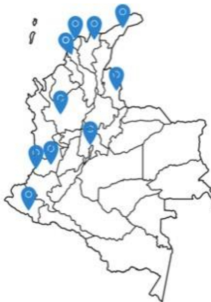
Figura 5. Mapa de sucursales Aviatour, elaboración propia, basado en (Aviatour, 2020)

La información brindada anteriormente acerca del grupo logístico de carga Aviatour y la agencia de aduanas Aviatour. Nivel 1, que pertenece al mismo grupo, es clave para el desarrollo del presente análisis mediante el cual se pretende llevar a cabo un plan de mejora enfocado en obtener la certificación de Operador Económico Autorizado OEA para la agencia de Aduanas de Aviatour.