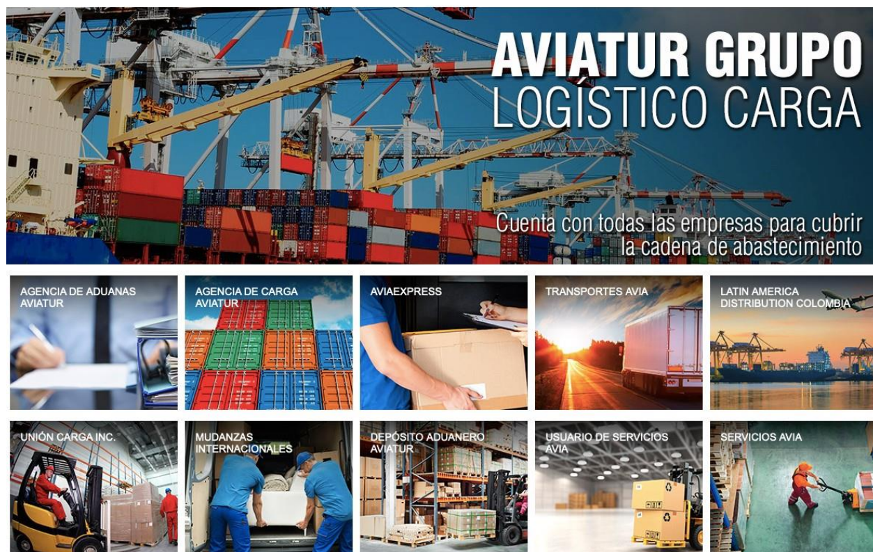
Figura 2. Composición de Aviatur grupo logístico de carga. Aviacarga, (2020)

Cómo se mencionó anteriormente una de las agencias que componen el grupo de carga de Aviatur es la Agencia de Aduanas Aviatur S.A, la cual atiende todos los trámites pertinentes para la nacionalización o exportación de mercancías, cumpliendo con todas las reglamentaciones exigidas por las autoridades, sin embargo la agencia se encuentra en la búsqueda de su mejoramiento empresarial y el aumento de su competitividad en el mercado aduanero colombiano, por lo que actualmente está en el proceso del logro de su meta a corto plazo que es obtener la certificación como Operador Económico Autorizado OEA y con ello alcanzar múltiples beneficios a nivel logístico y empresarial.