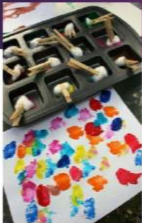
Figura 5. Materiales de trabajo 5. Autoría propia, con datos tomados de Pinterest (2020)