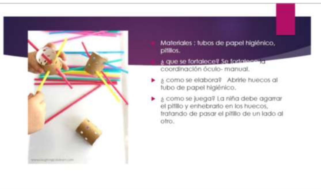
Figura 2. Materiales de trabajo 2. Autoría propia, con datos tomados de Pinterest (2020)