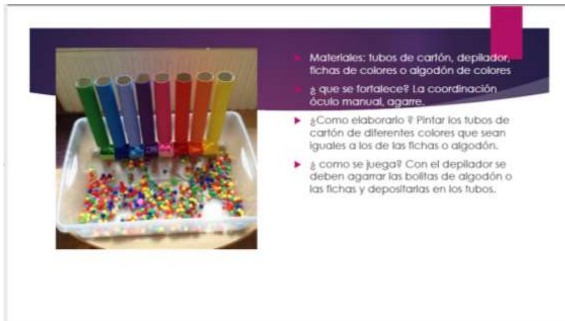
Figura 3. Materiales de trabajo 3. Autoría propia, con datos tomados de Pinterest (2020)