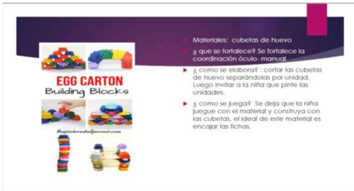
Figura 4. Materiales de trabajo 4. Autoría propia, con datos tomados de Pinterest (2020)