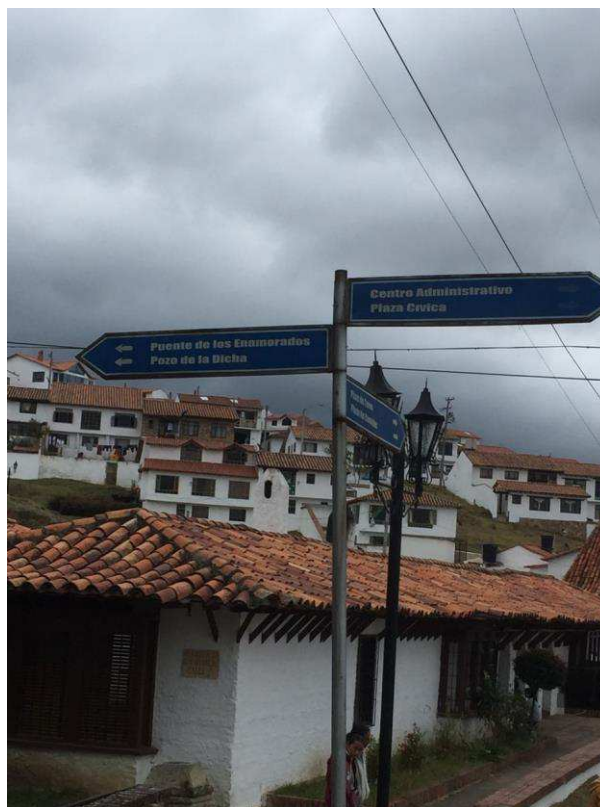
Figura 10. Ruta a Puente de los Enamorados.

Allí se observa un pequeño canal que transporta agua, de tipo riachuelo, el cual ya se encuentra seco y las condiciones ambientales del lugar se encuentran deterioradas, pues como se puede observar en la imagen la comunidad arroja a este canal basura y residuos sólidos que desencadenan una contaminación visual no apta para el desarrollo de una buena experiencia de cara al turista.