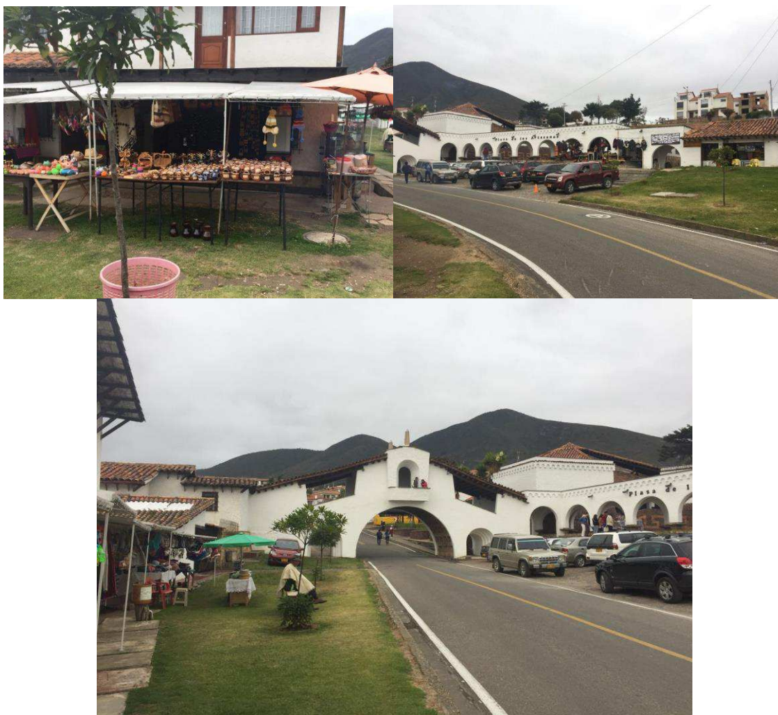
Figura 29. Plaza de los Artesanos.

Cabe resaltar que el sector de artesanos se encuentra en igual magnitud que los vendedores informales, afectados por la disminución significativa y acelerada de la afluencia turística en los últimos meses.