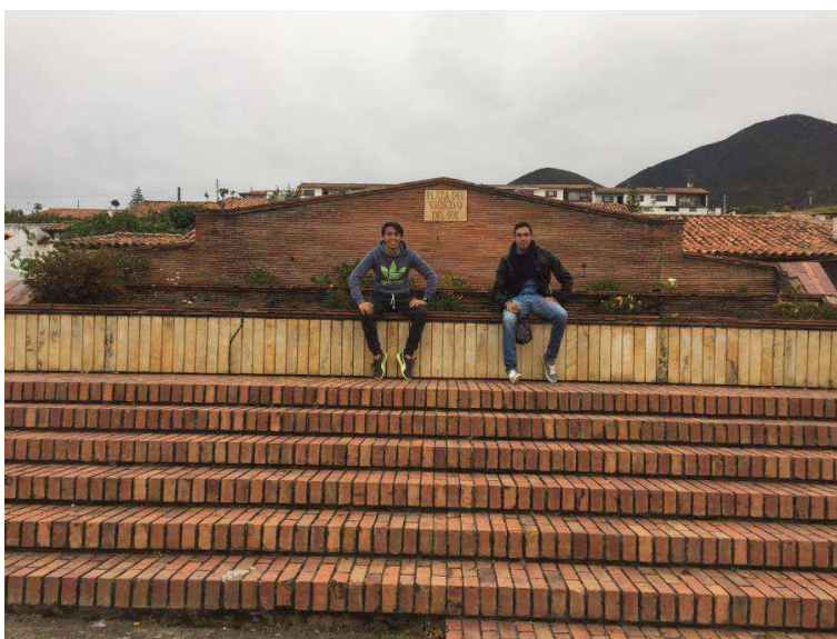
Figura 30. Plaza Kiosco del Sol. Autoría propia.