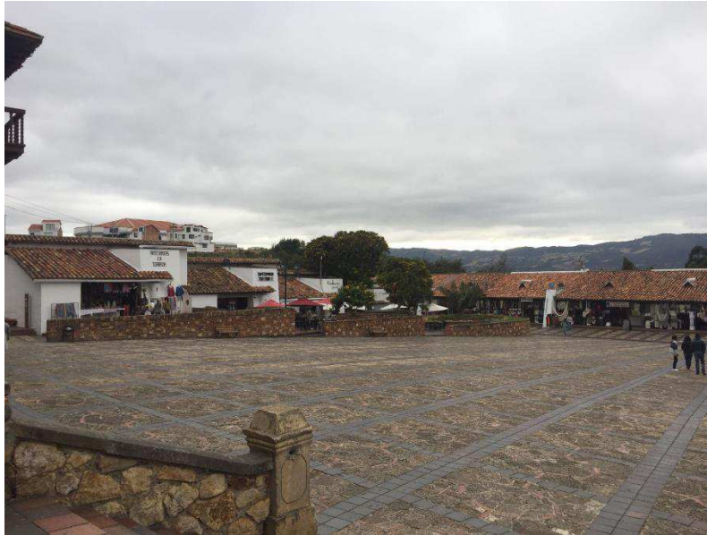
Figura 33. Parque Principal. Autoría propia.