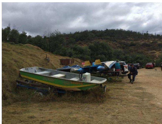
Figura 21. Embalse del Tominé.