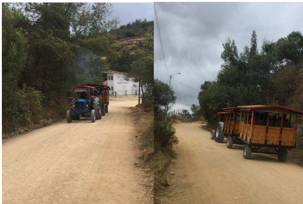
Figura 19. Vía a Embalse. Autoría Propia

Sin embargo, no se puede dejar de lado el aspecto ambiental y como se evidencia en la fotografía, la emisión de polución, gases y material particulado (Mp10) hacen que este medio de transporte y atractivo turístico presenta bajo nivel de sostenibilidad ambiental para la zona y población residente, de igual forma, disminuya la calidad del aire percibida por el turista.