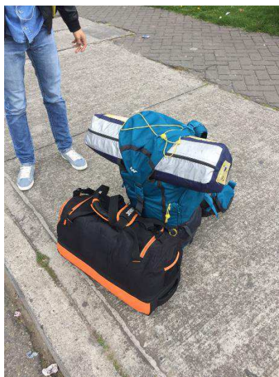
Figura 5. Inicio de Viaje de Campo. Autoría Propia.

A la llegada, se realizó un recorrido de aproximadamente 500 metros desde donde el transporte hace la parada hasta el ingreso al municipio. Se evidencio que para los turistas encontrar un restaurante donde vendan desayuno o una cafetería es un poco complicado pues se tuvo que realizar un recorrido aproximado de 10 minutos y solo se encontró una cafetería y un pequeño local comercial de características pintorescas pero acogedoras, este lugar se llama Los Montañeritos en el cual el menú que se encuentra disponible es huevos (batidos tipo ommelet o la típica changua), esto acompañado de variedad de pan y una bebida caliente por un valor de 3.000 pesos COP, el menú que se consumió fue el siguiente: