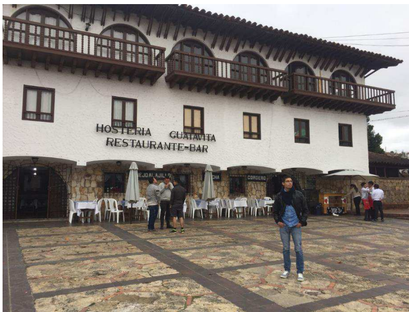
Figura 34. Parque Principal.

Esta plaza presenta una arquitectura colonial y encantadora, es el resultado de la inspiración de la firma de arquitectos Jaime Ponce de León Ltda. Que plasma un estilo moderno todo un conjunto estructural que enlaza en cada uno de sus rincones escenarios de corte pre colombino ,andaluz, colonial y contemporáneo .no solo su gente se trasladó también parte de la tradición de sus casas blancas ,tejas de barro, puertas de madera arcos, puentes ,plazas escaleras calles empedradas y una iglesia que aunque moderna, sigue guardando la fe .una construcción que