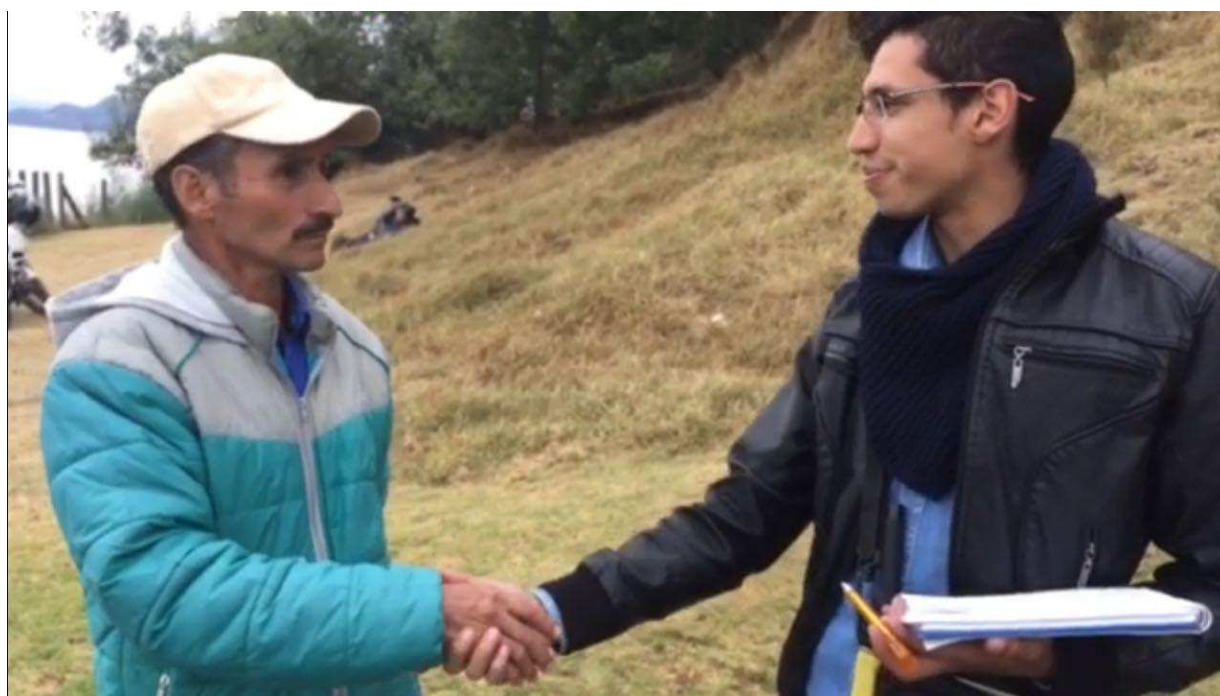
Figura 26. Antiguo Embarcadero.