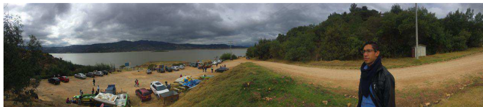
Figura 20. Embalse del Tominé. Autoría propia.

Como primera medida se realiza una inspección inicial de la periferia del lugar, Allí se observa el abandono de algunas lanchas que anteriormente prestaban el servicio de navegación y recorridos turísticos en el embalse, en la fotografía se puede apreciar cómo no solo se afecta la estética del lugar, sino también la contaminación ambiental de la zona, afectando de esta manera la flora y fauna del lugar, se evidencia el abandono por parte de los operadores turísticos a este tipo de embarcaciones desde hace aproximadamente cuatro años, esto genera una percepción negativa por parte del turista, puesto que al preguntar por el servicio de tours en lancha hacia el embalse, la primera respuesta es negativa y con dialogo no apropiado para la promoción del lugar.