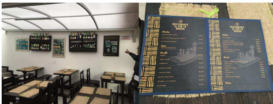
Figura 18. Restaurante el Fogón Dorado.

Al tomar la carretera destapada hacia el Embalse se visualiza otro medio de transporte que presta el mismo servicio que “La Guataviteña” llamado el “Guatatren” el cual es un tractor que hala dos vagones y tiene una capacidad de trasladar 24 personas y realizar el recorrido por el centro de Guatavita.