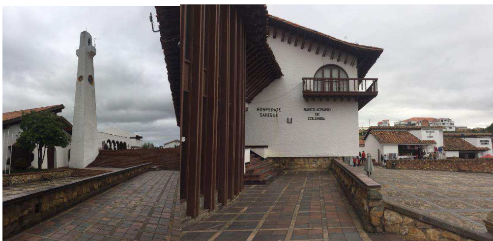
Figura 32. Parque Principal.

Allí en el parque queda la iglesia del municipio, el banco agrario de Colombia y un restaurante bar, en esta plaza es donde realizan las diversas celebraciones del municipio.