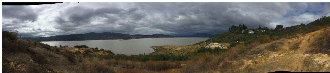
Figura 1. Embalse del Tominé.