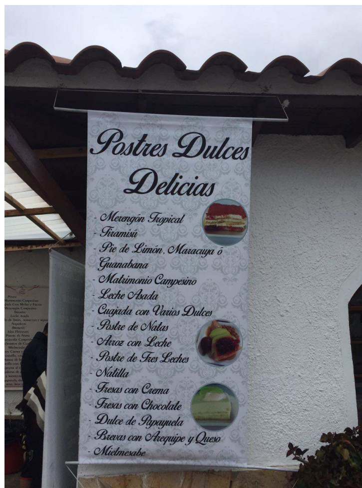
Figura 9. Dulces las Delicias. Autoría propia.

Durante el recorrido por las calles del pueblo, se realiza un corto circuito peatonal con fines diagnósticos, para verificar algunos de los puntos con atractivo turístico, allí se encuentra la ruta del puente de los enamorados.