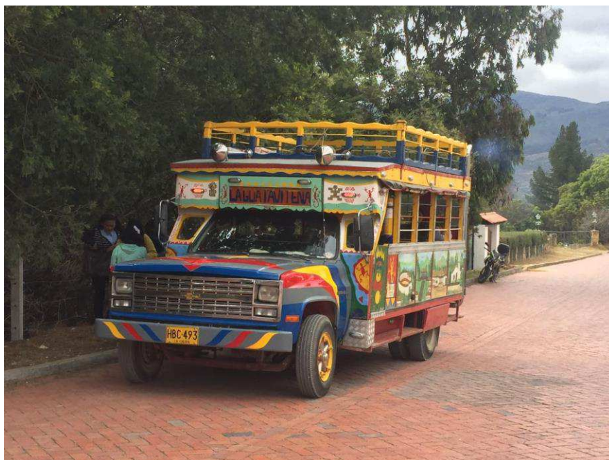
Figura 16. Plaza de los Artesanos. Autoría propia.

Se realiza una corta visita a un restaurante llamado el “Fogón del Dorado” allí se ingresa con el fin de obtener información, se observa la decoración del lugar donde se evidencian varios cuadros con imágenes del municipio del embalse, resaltando de esta manera un componente cultural de alto valor con objetivo de muestra hacia el turista de una perspectiva histórica y moderna, en el lugar se entabla una conversación con una de las meseras la cual informa acerca de los platos de la carta los días que más frecuentaban los turistas.