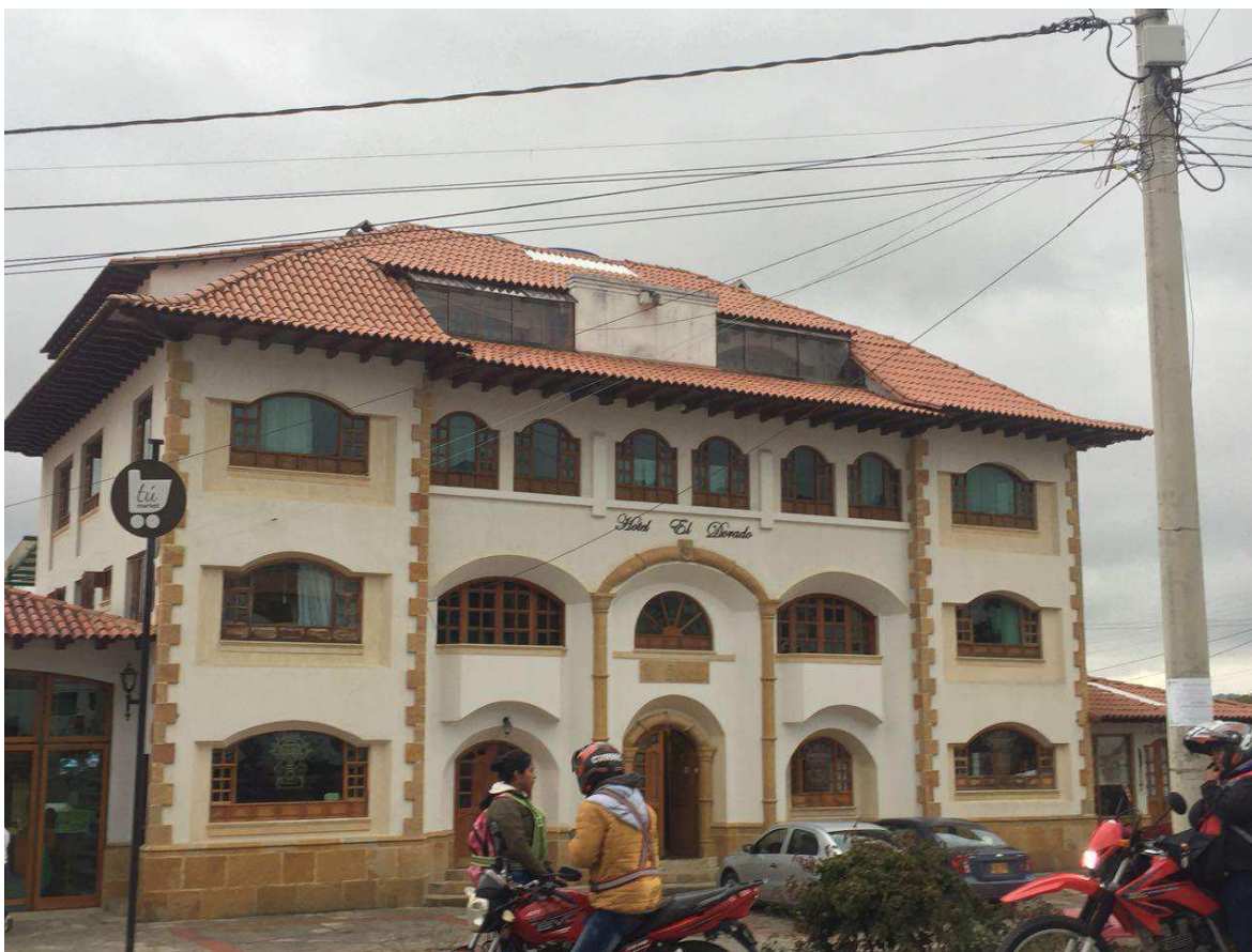
Figura 36. Hotel El Dorado.