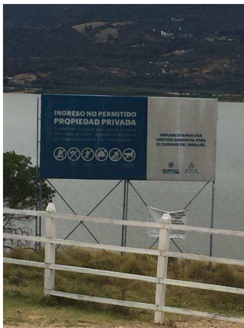
Figura 22. Embalse del Tominé.