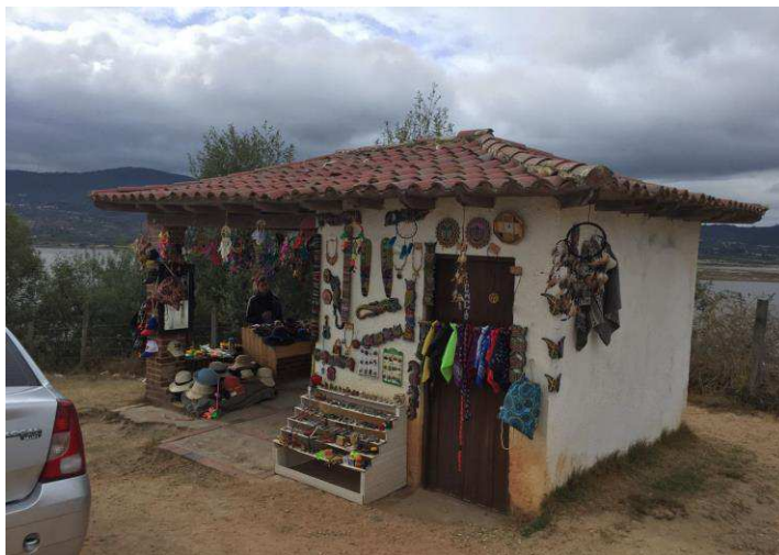
Figura 27. Mirador Tominé.

Sobre el camino u la carretera que con lleva al Embalse se encuentran diversos puestos de vendedores que se benefician del destino para vender diversas clases de productos de tipo gastronómico y artesanal, se establece comunicación con los vendedores e informan la situación que cumple con el patrón general del sector, la principal fuente de trabajo corresponde al turismo los fines de semana.