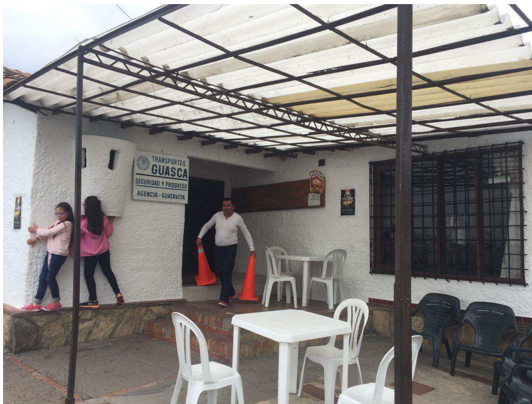
Figura 8. Agencia de Viajes Guasca.

Se ingresó e indagó acerca del servicio del transporte de este municipio donde informa el despachador que existen dos rutas de transporte, la primera es por la autopista norte, estos autobuses salen cada 15 min aproximadamente; y existe otra ruta por el corredor de la calera, pero por esta vía cada hora salen autobuses, lo que hace mejor opción por tiempo y distancia para el turista, tomar la vía por la autopista norte hacia Bogotá, el hecho de tener dos opciones de ruta hace que el acceso por temporada alta, se diversifique atrayendo de esta manera más turistas desde distintos puntos de la capital, de igual manera en el retorno hacia la ciudad de Bogotá quien es el mayor aportante en la afluencia turística del lugar.