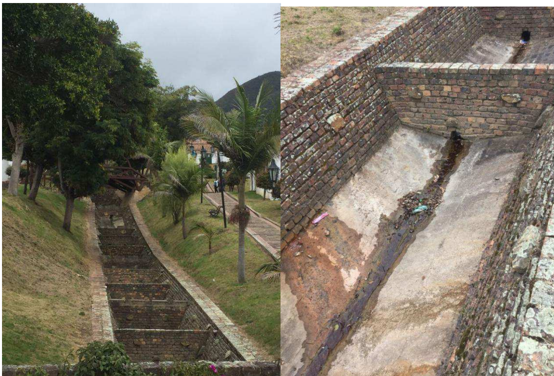
Figura 11. Ruta a Puente de los Enamorados.

La casa del ajedrez: Un lugar donde se reúnen las personas para practicar el deporte en mención, aunque no está abierto con frecuencia para el público visitante, lo que supone una pérdida de oportunidad en cuanto a oferta turística con respecto a un segmento de mercado especializado.