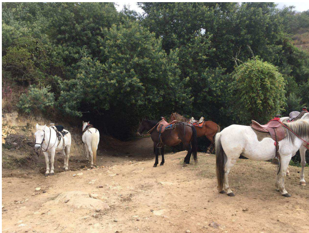
Figura 23. Embalse del Tominé.

capacitación de la labor turística es muy bajo, y se evidencia por medio de fuentes primarias que en el embalse como tal no se tiene guías certificados.