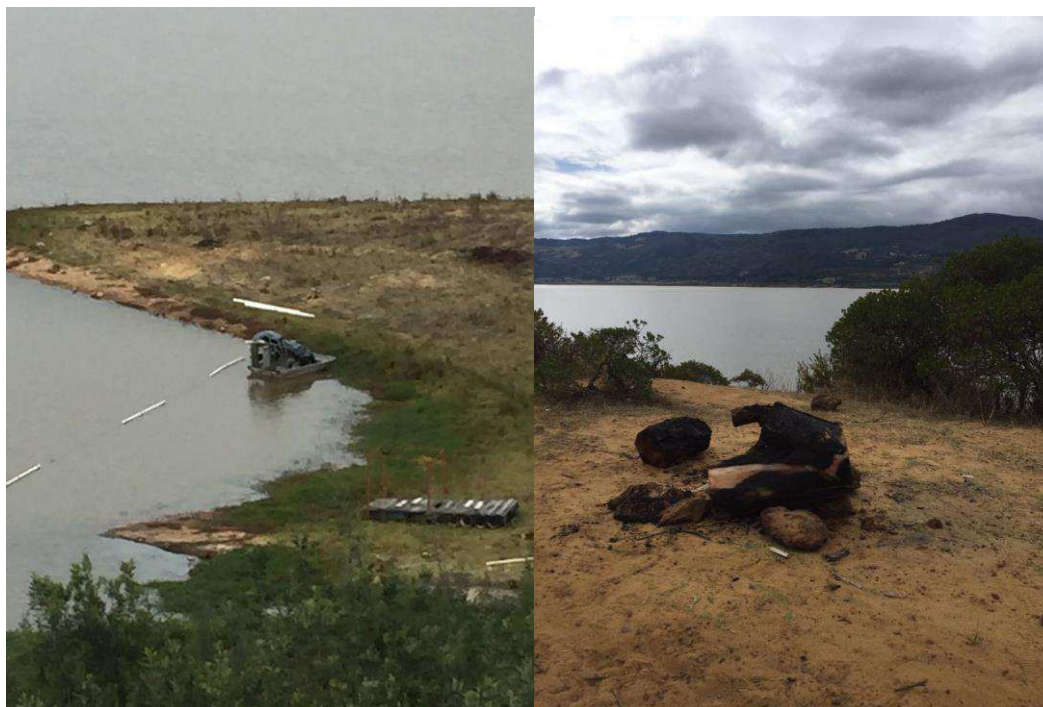
Figura 25. Embalse del Tominé.

En el transcurso de la tarde se observa la afluencia del turista que evidencia una cantidad mínima con respecto a la capacidad de carga del lugar, con respecto a los comportamientos de los turistas se indaga sobre la experiencia de asistir al Embalse las expectativas que traen y la experiencia que llevan luego de haber asistido al embalse, este factor nos deja como dato importante para la investigación que la expectativa supera la experiencia vivida, por lo tanto se asumen que el retorno del turista en situaciones posteriores no va a ser positivo ni reiterativo.