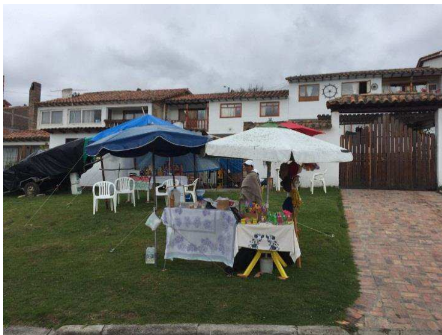
Figura 28. Camino Tominé. Autoría propia.

Sobre el camino u la carretera que con lleva al Embalse se encuentran diversos puestos de vendedores que se benefician del destino para vender diversas clases de productos de tipo gastronómico y artesanal, se establece comunicación con los vendedores e informan la situación que cumple con el patrón general del sector, la principal fuente de trabajo corresponde al turismo los fines de semana.