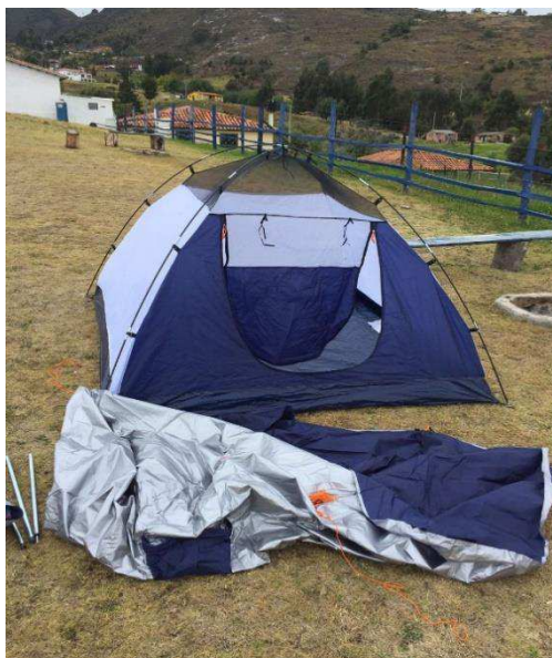
Figura 13. Zona de Camping “La Esperanza”.

Después de culminar con el proceso de instalación de la carpa, se inicia el recorrido con destino al Embalse Tominé y demás lugares de interés del municipio que tuvieran relación con el proyecto de investigación.