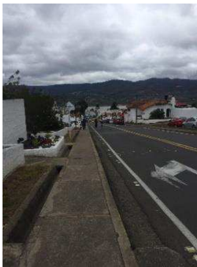
Figura 14. Calles Camino al Embalse.

Después de culminar con el proceso de instalación de la carpa, se inicia el recorrido con destino al Embalse Tominé y demás lugares de interés del municipio que tuvieran relación con el proyecto de investigación.