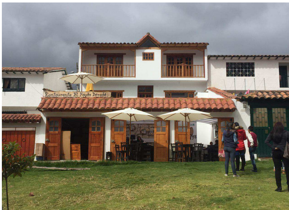
Figura 17. Restaurante el Fogón Dorado.