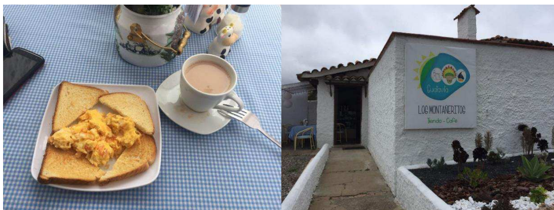
Figura 6. Desayuno. Autoría Propia.

Posteriormente se indago en establecimiento donde desayunamos si tenían conocimiento de algún lugar cercano donde se pudiera acampar ya que el tipo de alojamiento que se quería verificar para obtener una percepción externa del lugar era alojamiento no tradicional o zonas de camping, se llevaban todo los implementos para realizar dicha actividad, los dueños de este establecimiento informaron acerca de un lugar llamado La Esperanza que quedaba a 15 min aproximadamente caminando o 1 km de distancia desde el centro del municipio hacia la zona rural, esta experiencia nos pone en conocimiento que el acceso a las zonas de camping es tiene un nivel de dificultad medio, pues al no llevar medio de transporte propio se hace poco agradable cargar con carpas y demás elementos para acampar, sin embargo, se hace un recorrido por las calles de este pueblo en camino de este lugar donde se observa lo siguiente.