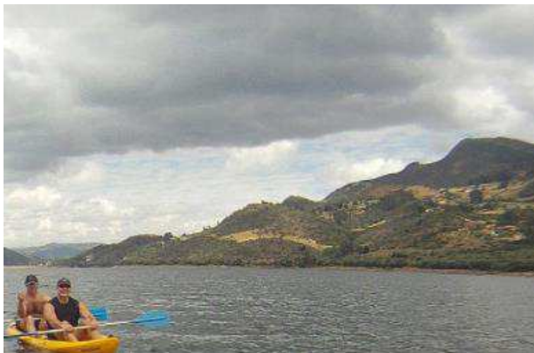
Figura 3. Embalse del Tominé.