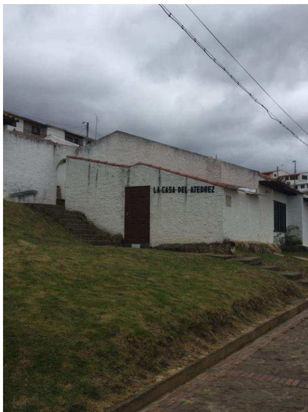
Figura 12. Casa del Ajedrez. Autoría propia.

Finalmente se llega al lugar “La Esperanza” realizando una caminata por la salida de Guatavita hacia Guasca tomando por una carretera destapada donde ofrecen el servicio de acampar por un costo por persona de $10.000, el lugar es agradable, cuenta con servicio de baño, zona de BBQ y una tienda donde se pueden comprar alimentos, bebidas y los productos de primera necesidad.