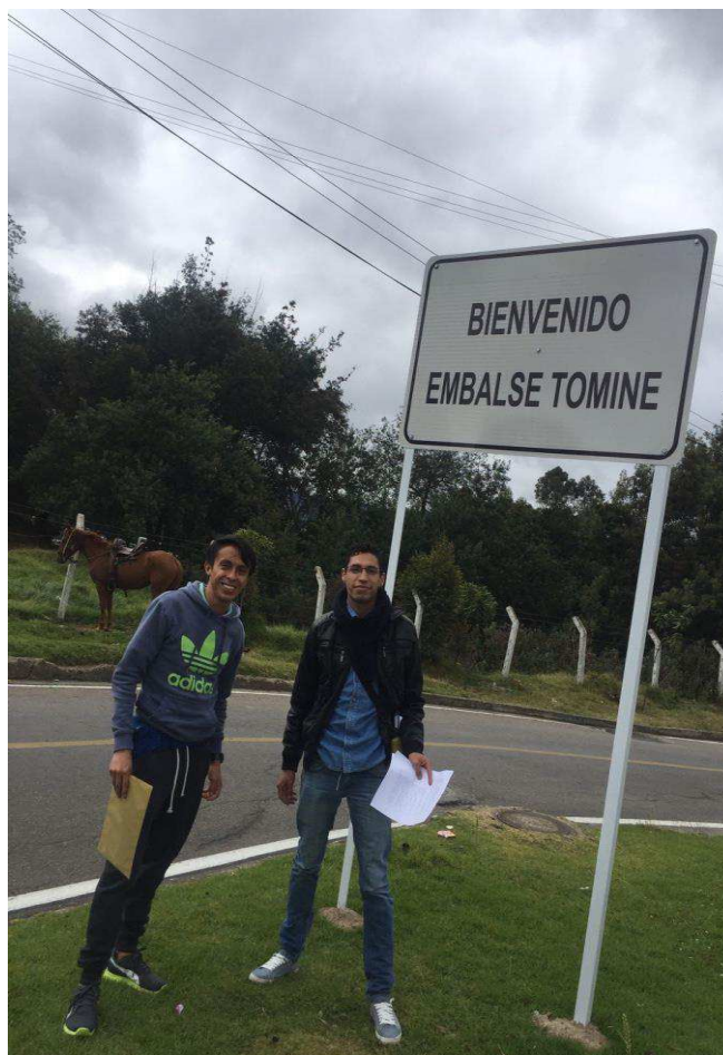
Figura 4. Embalse del Tominé-Guatavita.