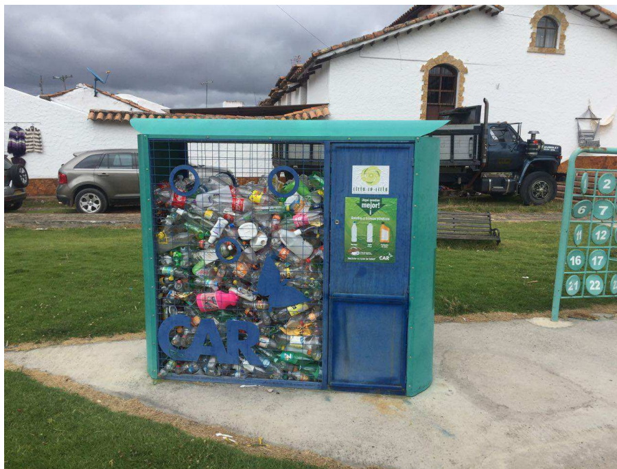
Figura 15. Plaza de los Artesanos.

hay mayor afluencia de turistas, esto con el objetivo de facilitar el reciclaje y crear una cultura ecológica con miras hacia una conciencia ambiental sostenible.