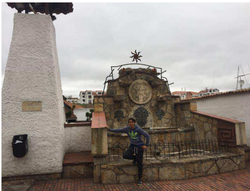
Figura 35. Atrio del Sol.

invita a caminar por cada uno de sus espacios y descubrir detalles arquitectónicos que lo hacen inolvidable.