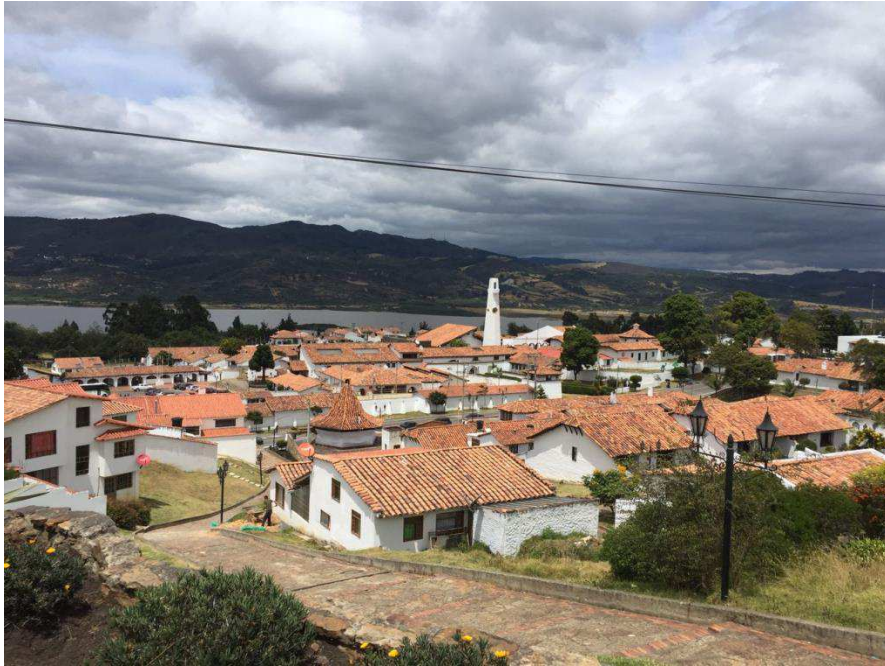
Figura 37. Guatavita. Autoría propia.

vive en este lugar con gran atención, un excelente servicio y amabilidad. Se finaliza el trabajo de campo y se toma el transporte nuevamente a la nos ciudad de Bogotá