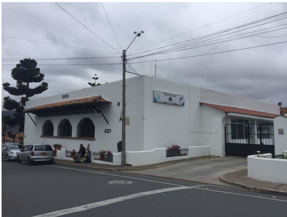
Figura 7. Hospital San Antonio.

Este es el único hospital o centro médico con el que cuenta el municipio que se encuentra categorizado dentro del nivel II, de igual manera se encuentra una sede de la IPS Eusalud, pero de acuerdo a los comentarios y la información brindada por los residentes de la zona, el que más se utiliza es el hospital, teniendo en cuenta el área y la cantidad de personas residentes, se puede inferir que el servicio médico está apto para atender las necesidades básicas de la población.