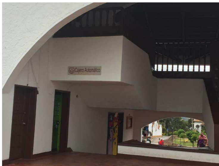
Figura 31. Parque Principal.

entrevistas formales. Como parte de la infraestructura que beneficia al turismo, se realiza visita al parque principal del municipio, donde se evidencian cajeros automáticos como lo son de Servibanca y Bancolombia.