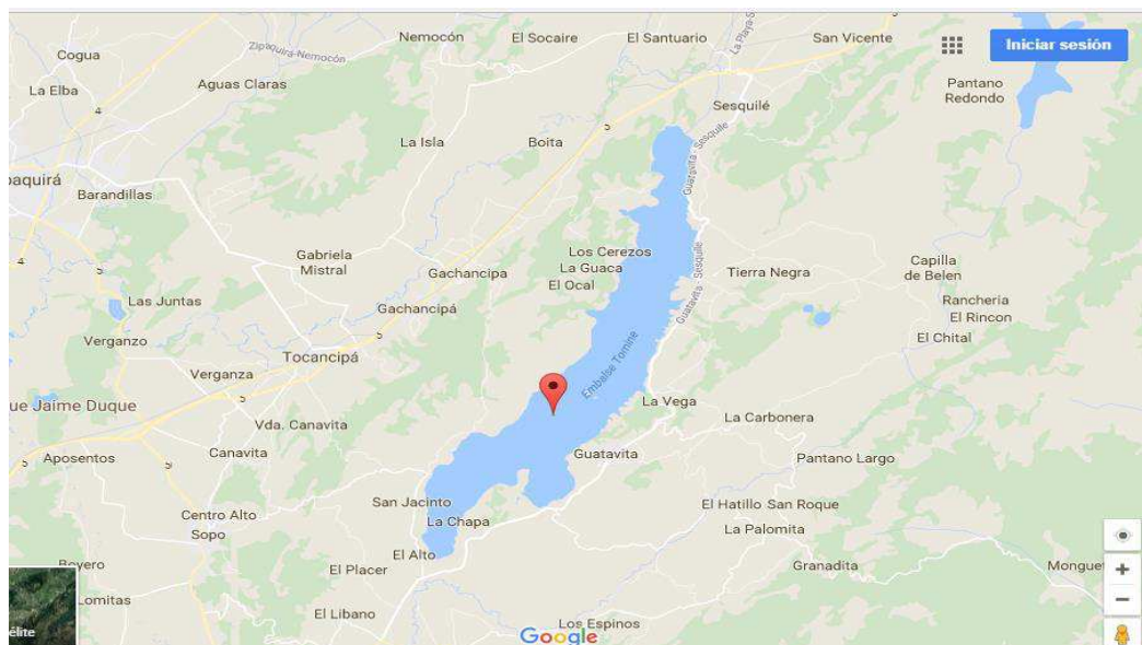
Figura 2. Ubicación embalse del Tominé.