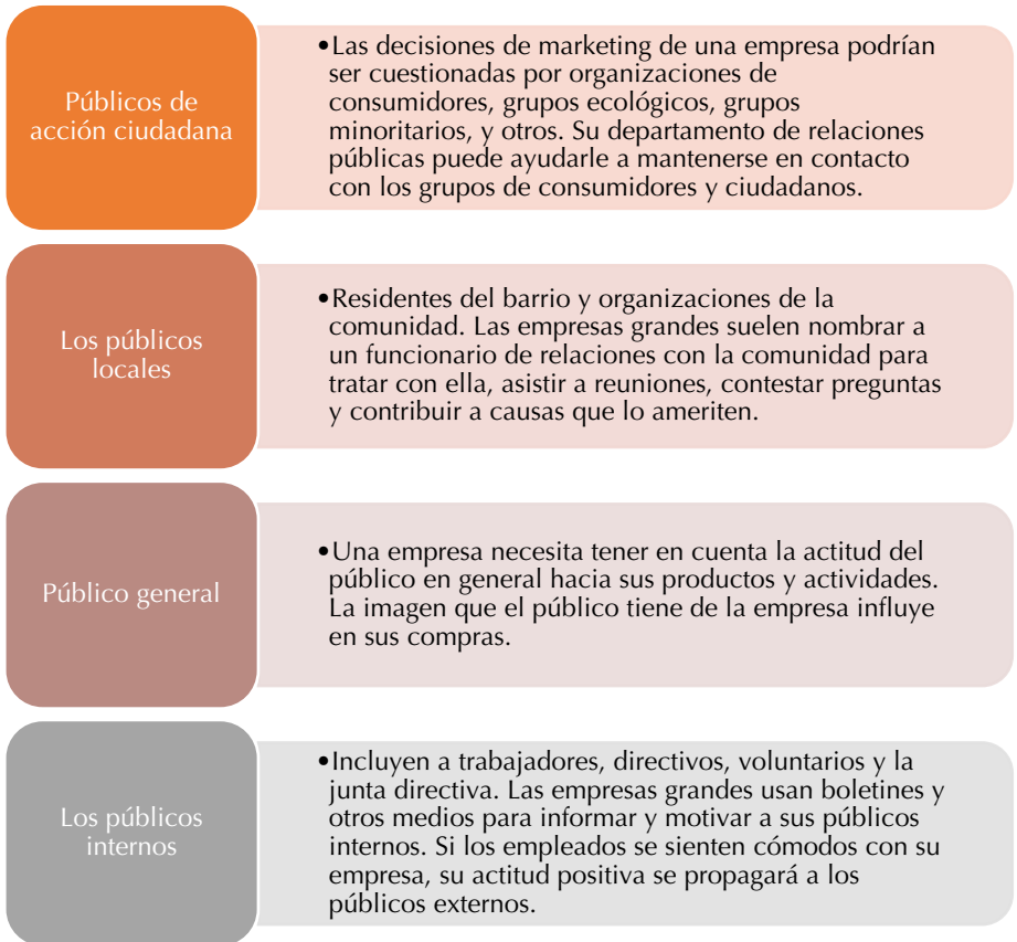
Figura 7. Diferentes públicos de interés. Fuente: Kotler y Armstrong (2008, p. 67).