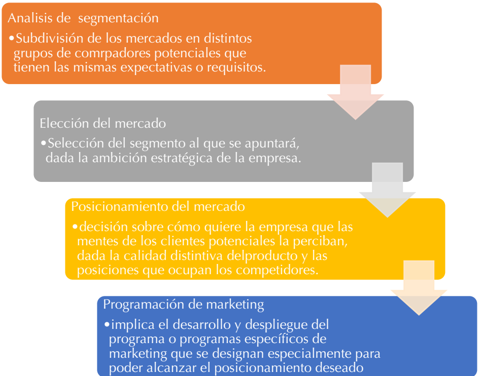
Figura 8. Proceso de segmentación.

Lambin, Galluci y Sicurello (2009) establecen cuatro pasos básicos para el proceso de una segmentación estratégica (Figura 8).