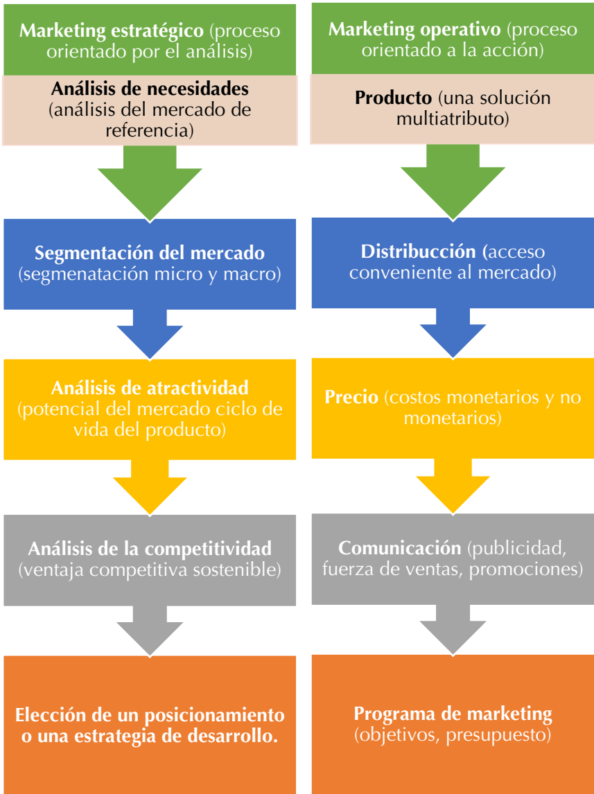
Figura 2. Las dos caras del proceso de Marketing. Fuente: Lambin, Galluci y Sicurello (2009, p. 7).

Al ser la primera acción, el marketing estratégico busca establecer y definir la situación actual de la empresa, lo que implica conocer las necesidades del consumidor y