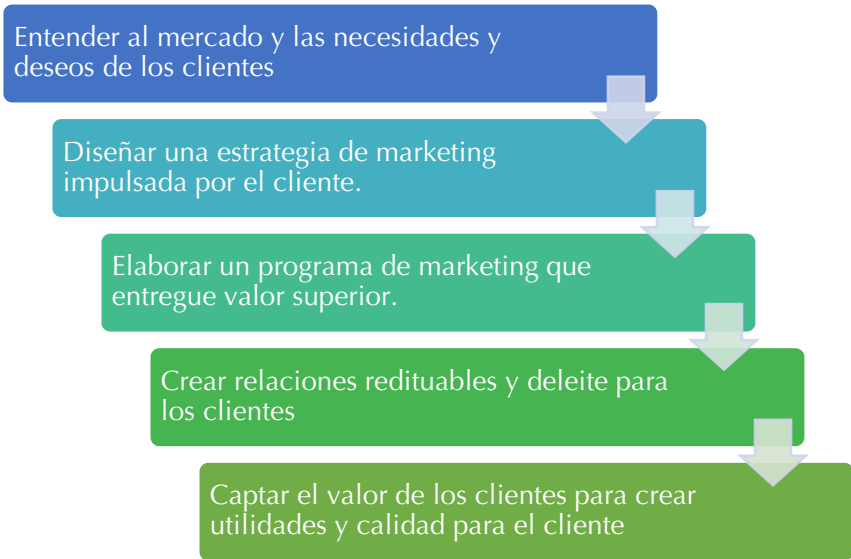
Figura 1. Modelo simple del proceso del Marketing. Fuente: Kotler y Armstrong, (2008, p. 6)

Los autores establecen que el marketing está en función de lograr generar valor a los clientes desarrollando relaciones duraderas y sostenibles para poder mantener las ventas y utilidades, pero para esto es importante entender a los consumidores, desarrollar productos o servicios que entreguen un valor superior a la competencia, estableciendo un diferencial en su propuesta estratégica, tal como lo podemos observar en la siguiente figura.