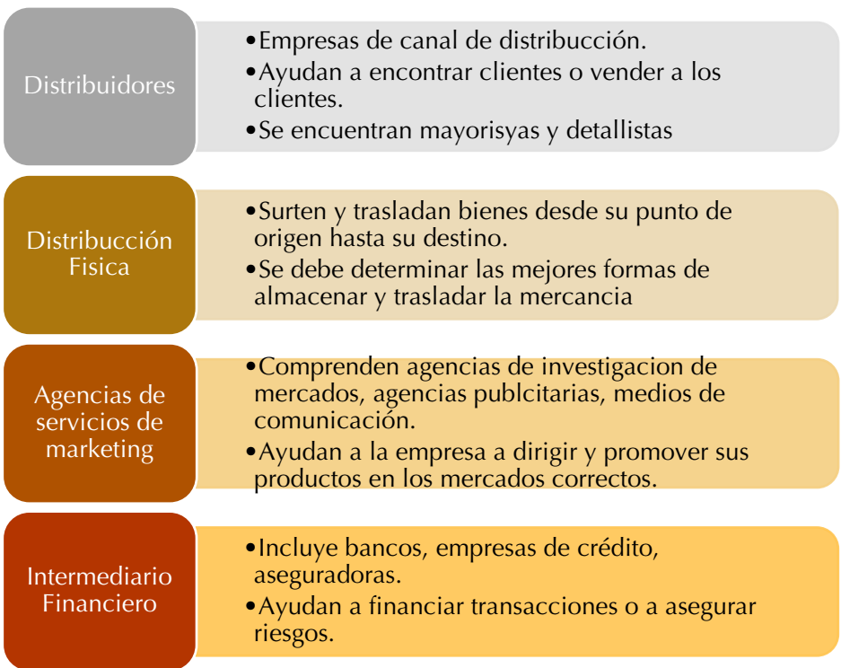
Figura 3. Diferentes tipos de intermediarios. Fuente: Kotler y Armstrong (2008, p. 66)

Al igual, la empresa debe tener intermediarios o aliados claves como elementos independientes, que ayudan directamente a