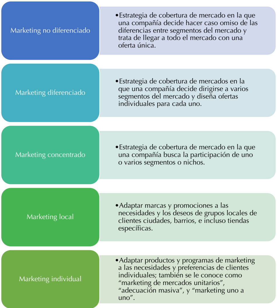
Figura 10. Estrategias de determinación de mercados meta. Fuente: Kotler y Armstrong (2008, p. 178).

Se deben considerar muchos factores al elegir una estrategia de determinación (selección) de mercados meta. La estrategia óptima depende de los recursos: si son limitados, es más razonable hacer marketing concentrado. La estrategia óptima también depende del grado de variabilidad del producto. El