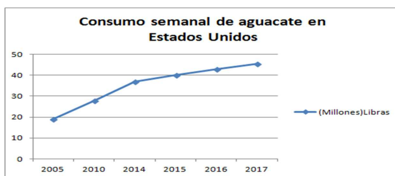
Figura 1 Consumo semanal de aguacate en Estados Unidos. Nota: Elaboración propia con datos de (Procolombia, 2017)

- El creciente consumo de esta fruta en este mercado estadounidense. La figura 1 demuestra cómo el consumo de aguacate semanal en Estados Unidos se encuentra en constante crecimiento, desde el 2005 hasta el 2017 el consumo de este aguacate ha pasado de 19 millones de libras hasta 45,5 respectivamente y según (ProColombia, 2017). Se estima que para el 2018 esta cifra llegue a los 47,6 millones de libras.