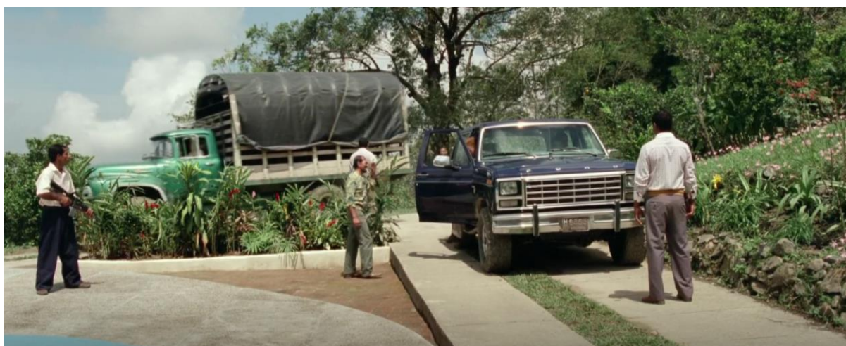
Figura 19. Camión 600 y camioneta Ford Ranger F-150. Guerra y Gallego (2018, 1:21:59).