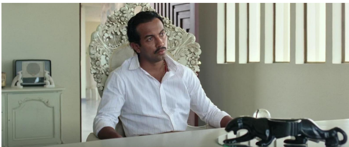
Figura 28. Rapayet en la mansión. Guerra y Gallego (2018, 1:07:41).