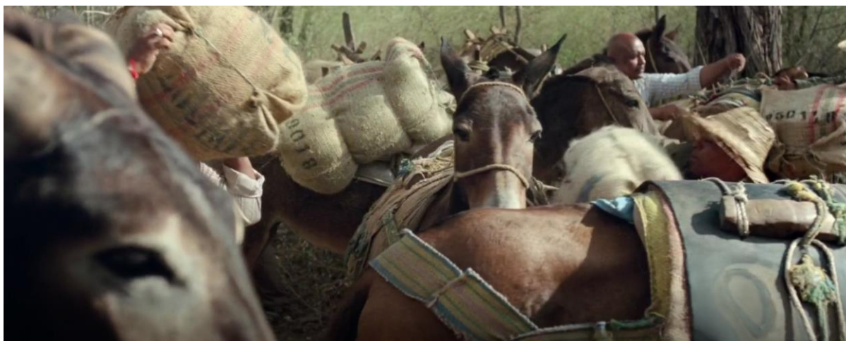
Figura 14. Burros cargados de marihuana. Guerra y Gallego (2018, 0:40:03).