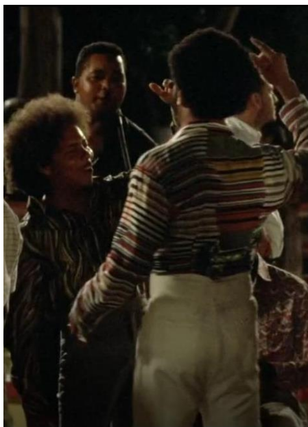
Figura 39. Moisés ‘culo puyú’. Guerra y Gallego (2018, 0:47:48).

Sorprende ver como incluso estos detalles que pueden pasar desapercibidos para el espectador, también se tuvieron en cuenta a la hora de producir esta película, el peso cultural que se maneja en Pájaros de Verano impresiona, ya que se puede ver cómo cuidaron cada detalle para reconstruir parte de la realidad de lo que fue la Bonanza Marimbera. La película muestra que los marimberos sintieron la necesidad de armarse para poder proteger su negocio y sus familias, cosa que antes no se ve dentro de Pájaros de Verano .