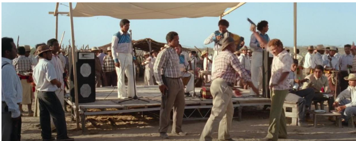
Figura 36. Leonidas disparando al aire. Guerra y Gallego (2018, 1:04:15).

Y en un segundo momento, se puede ver a Leonidas dando tiros al aire para que la parranda vallenata comience a tocar.