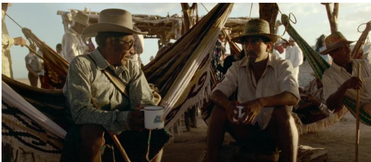
Figura 27. Palabrero y Rapayet. Guerra y Gallego (2018, 0:47:48).