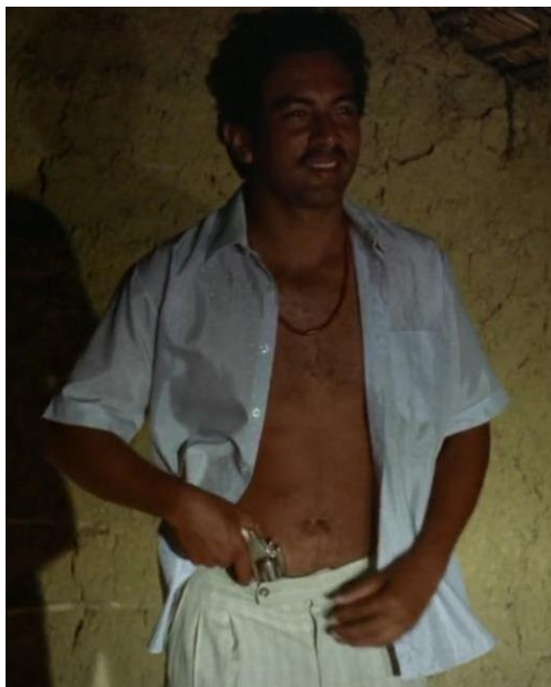
Figura 38. Rapayet ‘cacha afuera’. Guerra y Gallego (2018, 0:33:50).