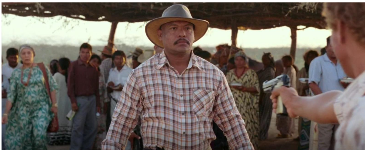
Figura 37. Leonidas apuntándole a un trabajador. Guerra y Gallego (2018, 1:04:26).

Con estas representaciones se le muestra al espectador el peso que tienen los tiros al aire en la cultura de los “narcos”. Esto ya se ha visto en varias representaciones relacionadas con el narcotráfico y se reafirma nuevamente en Pájaros de Verano . Los tiros empiezan a ser una forma de comunicación, como se dijo anteriormente, estos daban inicio a las fiestas o era una manera de marcar territorio. Se han convertido en un factor importante cuando se está reconstruyendo de manera visual alguna historia relacionada al narcotráfico.