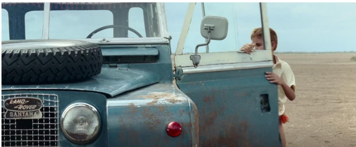
Figura 21. Land Rover Santana de color azul y blanco. Guerra y Gallego (2018, 0:50:57).

Resulta curioso ver que se buscaron referencias de autos utilizados en la bonanza, generando un contexto más real en el espectador y mostrando similitudes con la realidad sobre cómo se transportaba la marihuana y cómo se trasladaban los marimberos de la región. Ver marcas o referencias de estos vehículos enriquece la estética narrativa que se plantea en la película Pájaros de Verano .