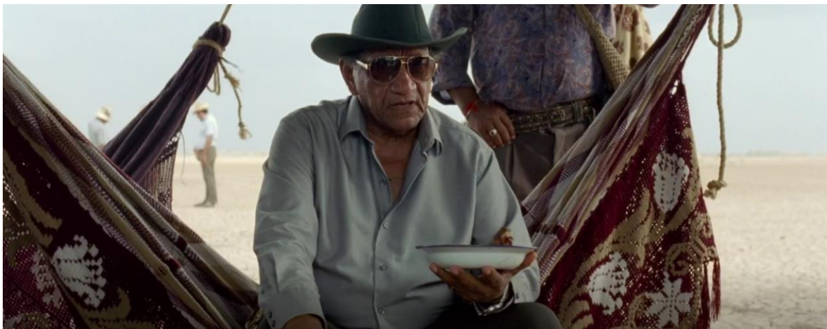
Figura 5. Aníbal. Guerra y Gallego (2018, 0:45:33).