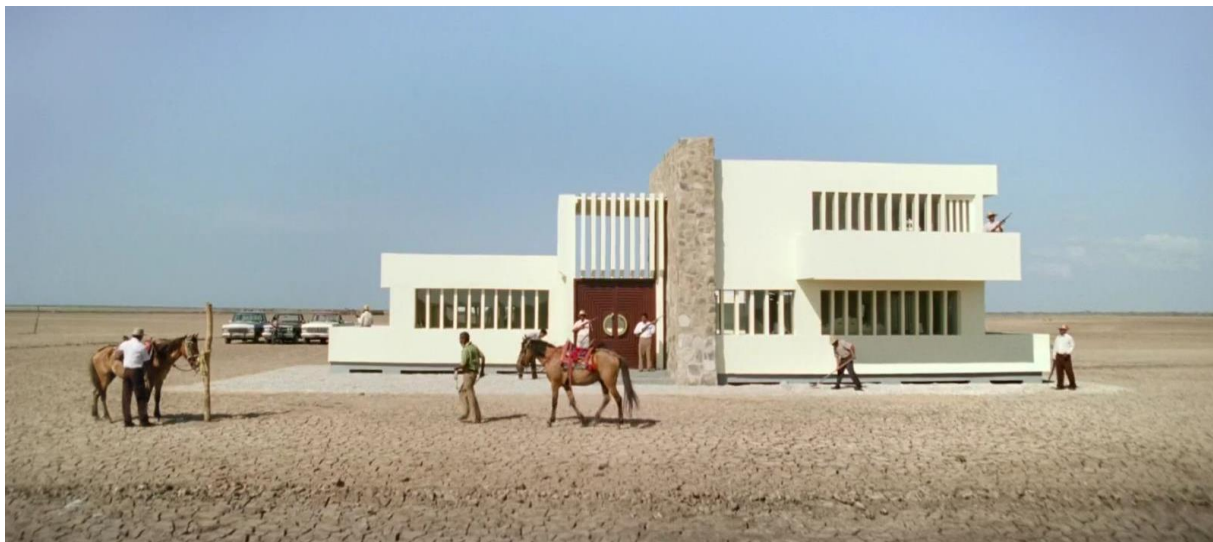
Figura 26. Mansión Pushaina. Guerra y Gallego (2018, 1:01:17).