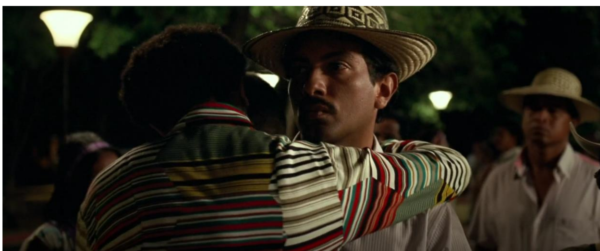
Figura 44. Moisés abrazando a Rapayet. Guerra y Gallego (2018, 0:48:23).

Si bien no se muestra la larga lista de canciones que los cantantes y compositores de vallenato les hicieron a los marimberos, sí hacen mención a una de las canciones más famosas de la época, y es El Gavilán Mayor . El hecho de que Pájaros de Verano incluya esta canción dentro del largometraje, evidencia que los directores tuvieron en cuenta cada detalle, por más pequeño que fuera, como lo es incluir esta canción dentro del filme con el objetivo de mostrar esta idealización de los marimberos para esta época dentro del vallenato.