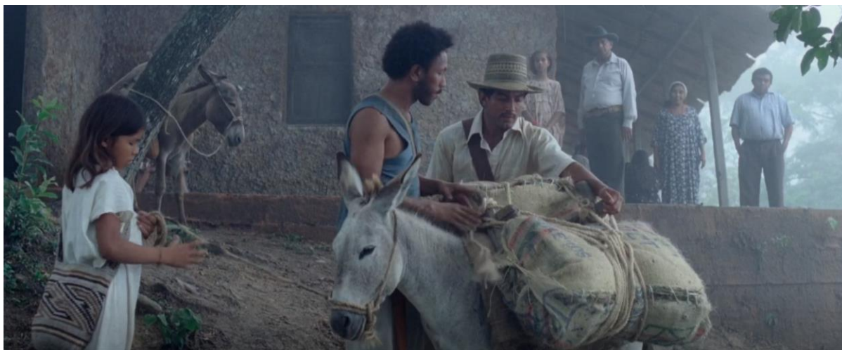
Figura 13. Burro cargado de marihuana. Guerra y Gallego (2018, 0:28:16).

En Pájaros de Verano se logra percibir que uno de los primeros medios utilizados para transportar marihuana fueron las mulas. Sin embargo, en esta representación no se muestra que los arrieros estuvieran armados o fueran acompañados por “cuadrillas de pistoleros”, como se explicó en el párrafo anterior.