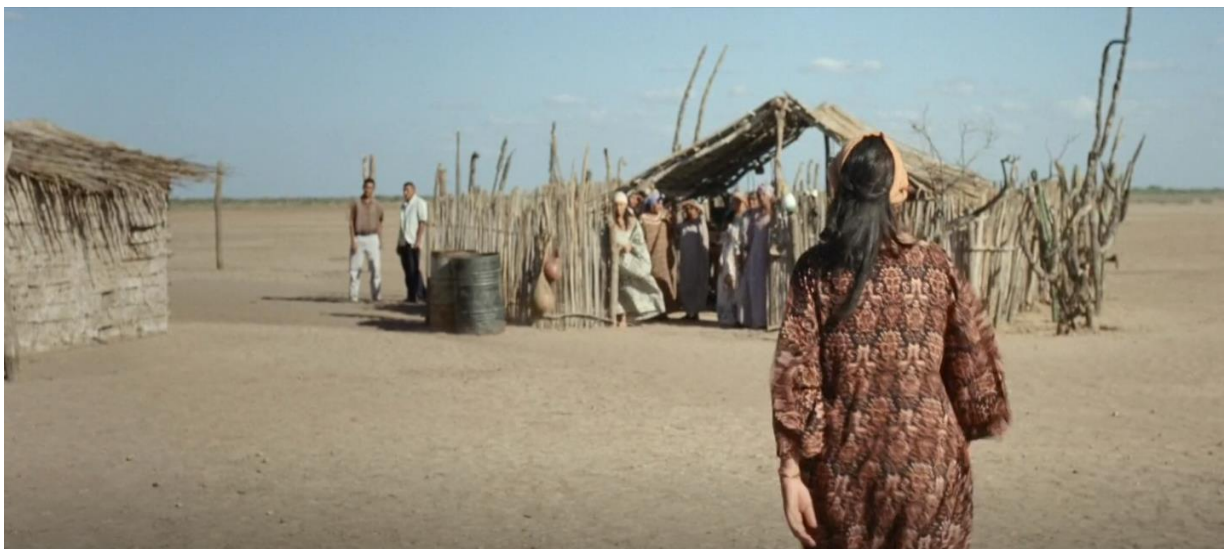
Figura 25. Choza. Guerra y Gallego (2018, 0:31:50).

La película narra la transformación de una sociedad. Cómo Colombia pasa de ser una sociedad rural, con unas tradiciones y un arraigo muy fuerte, y como llega el capitalismo salvaje y transforma todo. Eso que ha transformado nuestro país durante décadas, se produjo en el territorio Wayúu en pocos años.