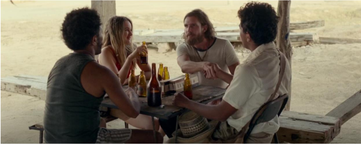
Figura 3. Trato con los estadounidenses. Guerra y Gallego (2018, 0:20:42).

Narrativamente, se puede ver como Ciro Guerra y Cristina Gallego tienen en cuenta varios factores o hechos que realmente fueron importantes para la bonanza. El hecho de mostrar en un plano a detalle los panfletos utilizados por los Cuerpos de Paz contra el comunismo o ver detalles como el banano sobre el bus, deja en claro el proceso de investigación que realizaron los directores antes de producir la película.