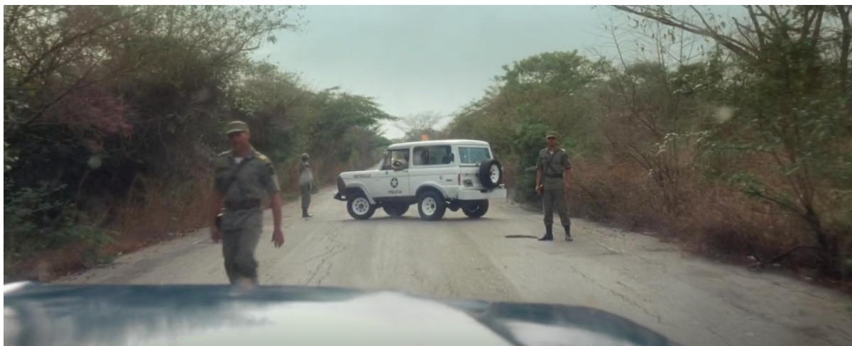
Figura 22. Reten de policía. Guerra y Gallego (2018, 0:40:47).

Como se puede evidenciar en una escena de la película, mientras Rapayet y Moisés van con su cargamento se encuentran un retén de policía, uno de los policías se acerca y habla con ellos, se logra ver que existe confianza entre las dos partes por la forma en la que se comunican, utilizando apodos y haciendo chistes entre ellos. Al final de la escena Moisés le entrega un fajo de billetes y ellos abren el paso para las camionetas llenas de marihuana.