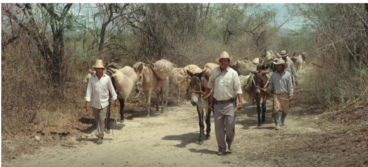
Figura 33. Cargamento de marihuana en burros. Guerra y Gallego (2018, 0:39:43).