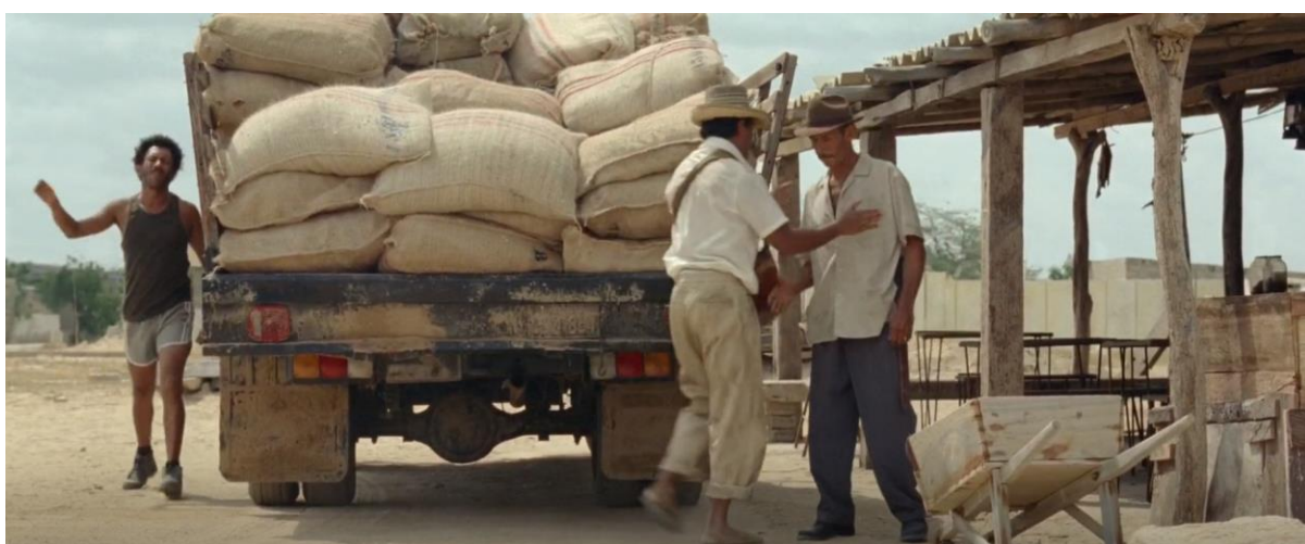
Figura 9. Bultos de café. Guerra y Gallego (2018, 0:18:00).