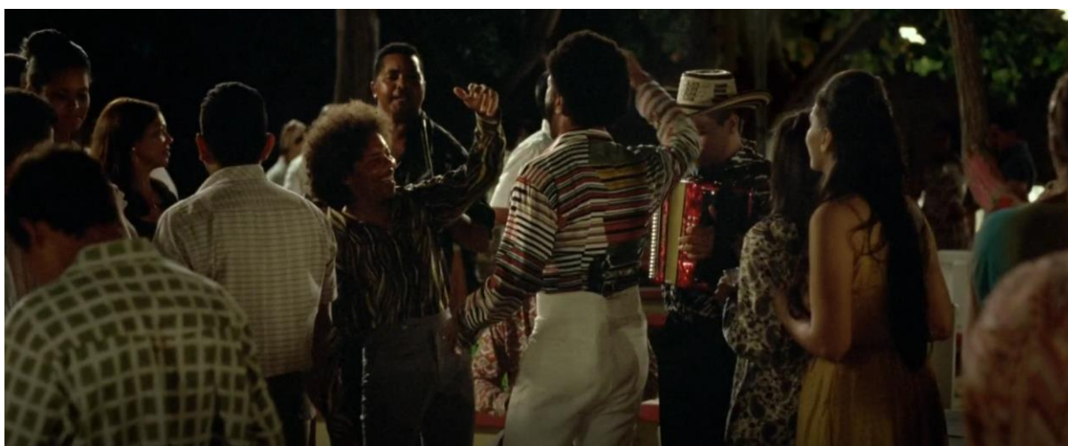
Figura 41. Parranda vallenata. Guerra y Gallego (2018, 0:47:47).