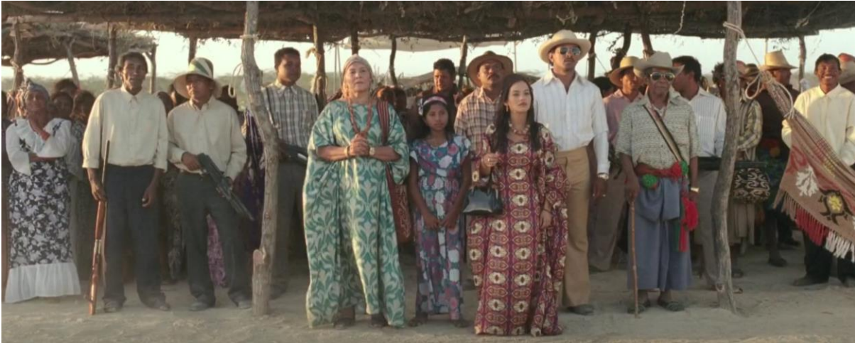
Figura 6. Familia Pushaina. Guerra y Gallego (2018, 1:02:15).

Como se puede evidenciar, Pájaros de Verano representa a una familia Wayúu inmersa en el narcotráfico de marihuana, realizando cierta similitud con hechos reales, ya que para aquella época las estructuras mafiosas eran conformadas principalmente por las familias Dávila Armenta y Dávila Jimeno, quienes manejaron el negocio de forma pública, debido a que las autoridades civiles y militares tenían conocimiento de lo que se estaba realizando. Para estas familias fue sencillo entrar en el tráfico de marihuana, pues tenían conocimiento previo en producción y exportación de cultivos (Beltrán et al., 2013, p. 58).