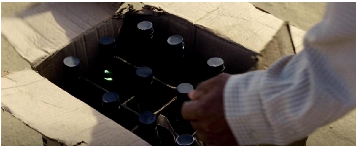
Figura 7. Contrabando de licores. Guerra y Gallego (2018, 0:16:12).