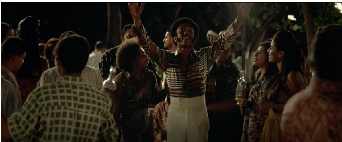
Figura 43. Moisés celebrando. Guerra y Gallego (2018, 0:48:05).