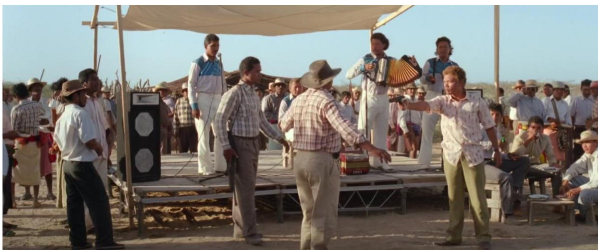
Figura 42. Leonidas con parranda vallenata. Guerra y Gallego (2018, 1:04:22).