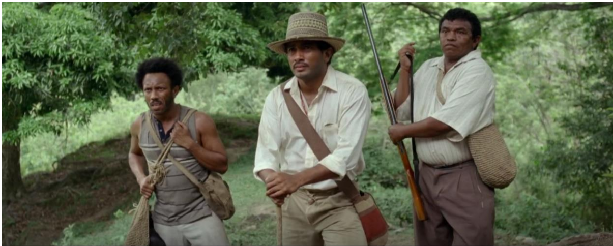
Figura 4. Rapayet en la finca de Aníbal. Guerra y Gallego (2018, 0:24:22).

No es novedad que se hable de familias que en su totalidad quedan involucradas en el negocio del narcotráfico, esto viene siendo un patrón que se repite en cada mafia de las drogas y en cada representación que se realiza. Pájaros de Verano no es la excepción, se puede ver la ruptura tanto familiar como en los círculos sociales cercanos, cuando se traicionan unos a otros.