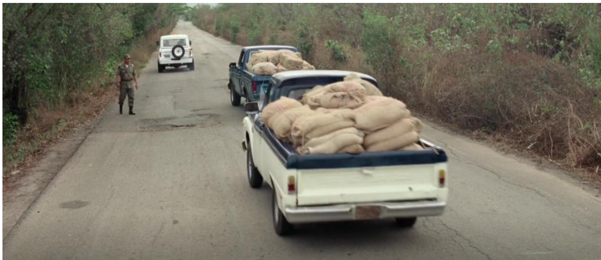
Figura 17. Ford Ranger F-100 de color azul y blanco cargada de marihuana. Guerra y Gallego (2018, 0:41:29).