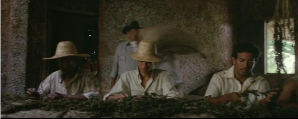
Figura 11. Rapayet desmoñando marihuana. Guerra y Gallego (2018, 0:26:00).