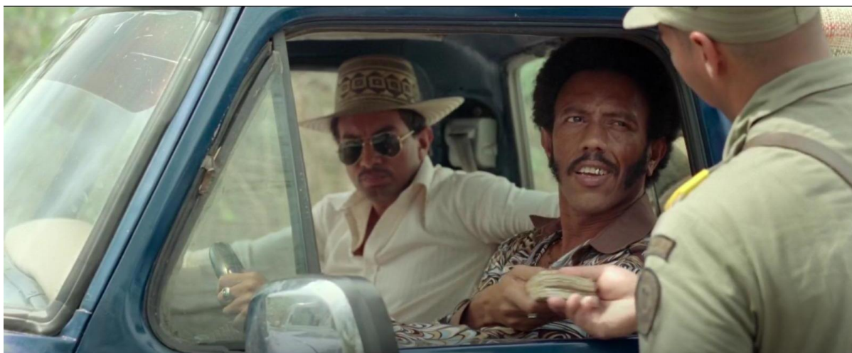
Figura 24. Soborno a la policía. Guerra y Gallego (2018, 0:41:08).

Si en la historia de la bonanza no se supiera que los policías hicieron parte de esto, sería difícil de creer para la población. Aunque en la película no se muestra algo tan amplio de cómo la policía estuvo involucrada, sí se hace alusión a esa parte de la historia, generando que el espectador se interese y logre ver que no solo la bonanza sucedió gracias a los marimberos, sino que instituciones del Estado también ayudaron a que esta sucediera y además se beneficiaron de ella.