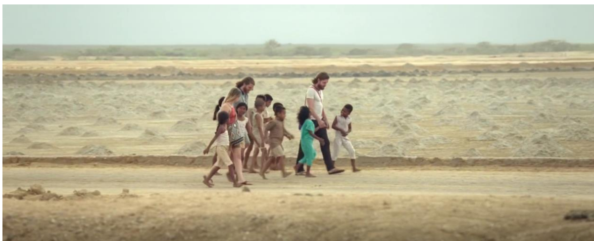
Figura 1. Cuerpos de paz. Guerra y Gallego (2018, 0:18:58).

Además, el hecho de mostrar este suceso con los Cuerpos de Paz, se da a entender que, aunque los directores no se enfocaron mucho en contar todo lo que sucedió en la “Guerra contra las drogas”, sí decidieron representar el precedente de los Cuerpos de Paz para así mostrarle al espectador que esto fue lo que marcó el comienzo del narcotráfico en Colombia.