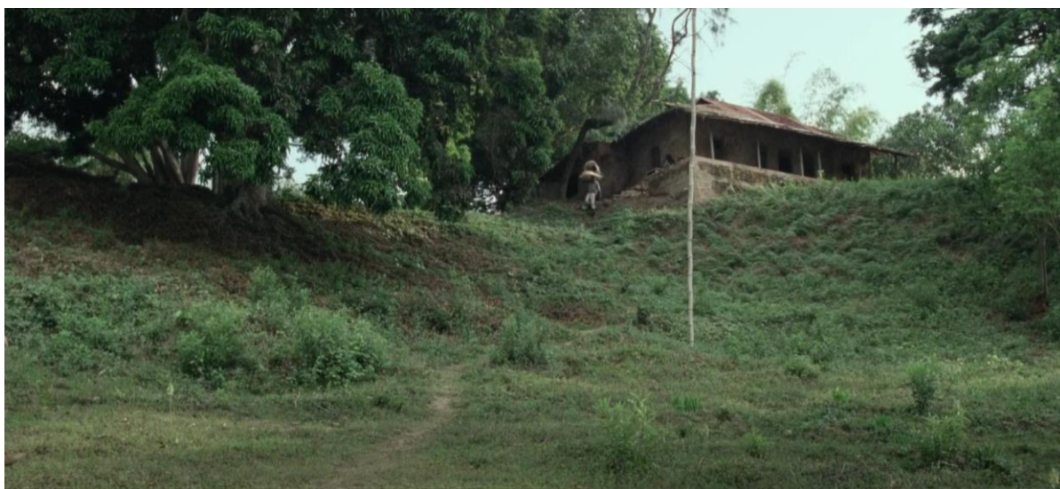
Figura 31. Finca de Aníbal sin pistoleros. Guerra y Gallego (2018, 0:23:51).