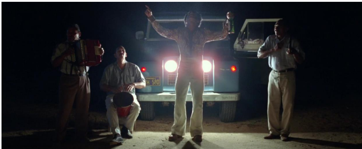
Figura 40. Moisés con parranda vallenata. Guerra y Gallego (2018, 0:33:50).