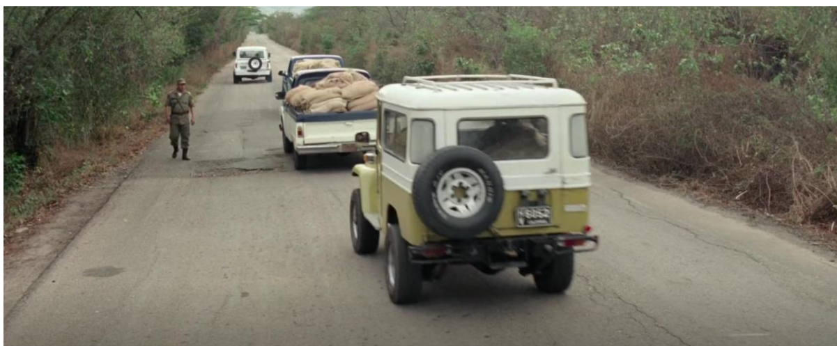
Figura 18. Toyota Land Cruiser FJ43 de color blanco y verde cargada de marihuana. Guerra y Gallego (2018, 0:41:31).