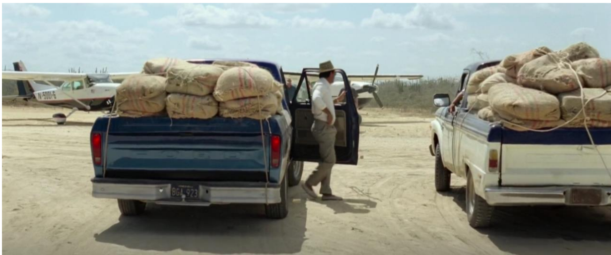
Figura 16. Ford Ranger F-150 de color azul cargada de marihuana. Guerra y Gallego (2018, 0:41:19).

A lo largo de la película Pájaros de Verano se pueden ver diferentes autos o camionetas que fueron utilizadas durante la bonanza, dentro de las diferentes marcas se encuentran Land Rover, Ford y Toyota, las cuales para esta época tenían modelos como, Toyota Land Cruiser FJ43, Land Rover Santana, Ford Ranger F-100 y Ford Ranger F-150. Además de ello, se encuentra una referencia al camión 600. Los vehículos mencionados son modelos de los años 70s y 80s haciendo referencia a la línea temporal en la cual sucede la película y la Bonanza Marimbera.