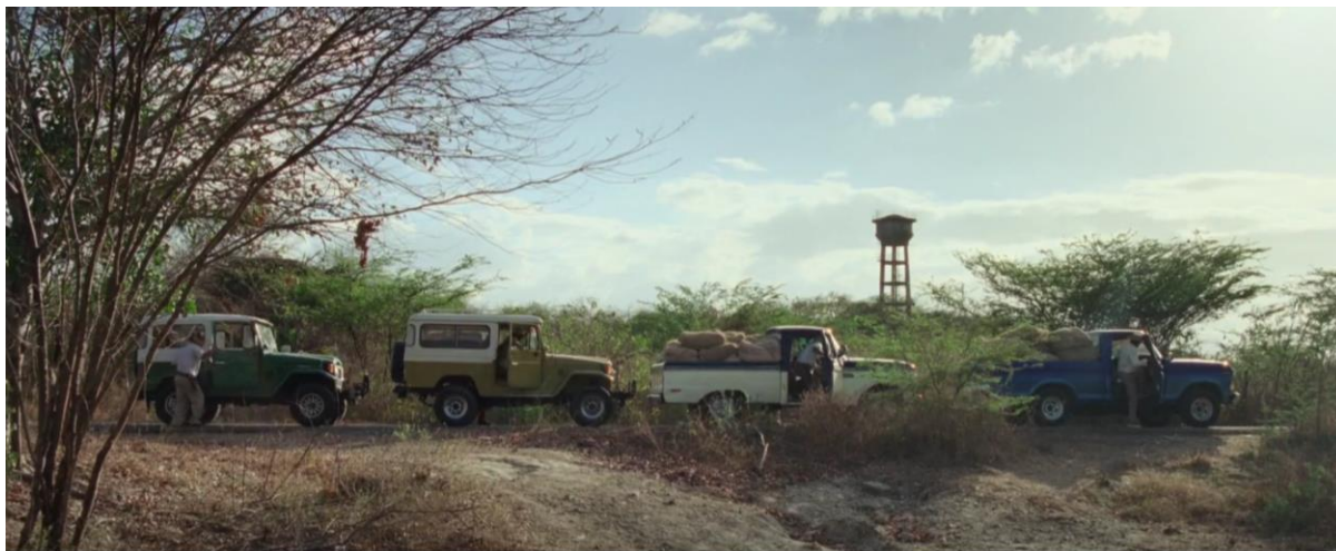
Figura 20. Dos Toyota Land Cruiser FJ43, Ford Ranger F-100 y Ford Ranger F-150, respectivamente cargadas de marihuana. Guerra y Gallego (2018, 0:40:16).

En la izquierda se encuentra un camión de carga, que puede aludir a un camión 600 y en la derecha se ve la camioneta Ford Ranger F-150.