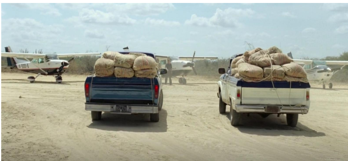
Figura 34. Cargamento de marihuana en camionetas y avionetas. Guerra y Gallego (2018, 0:41:50).