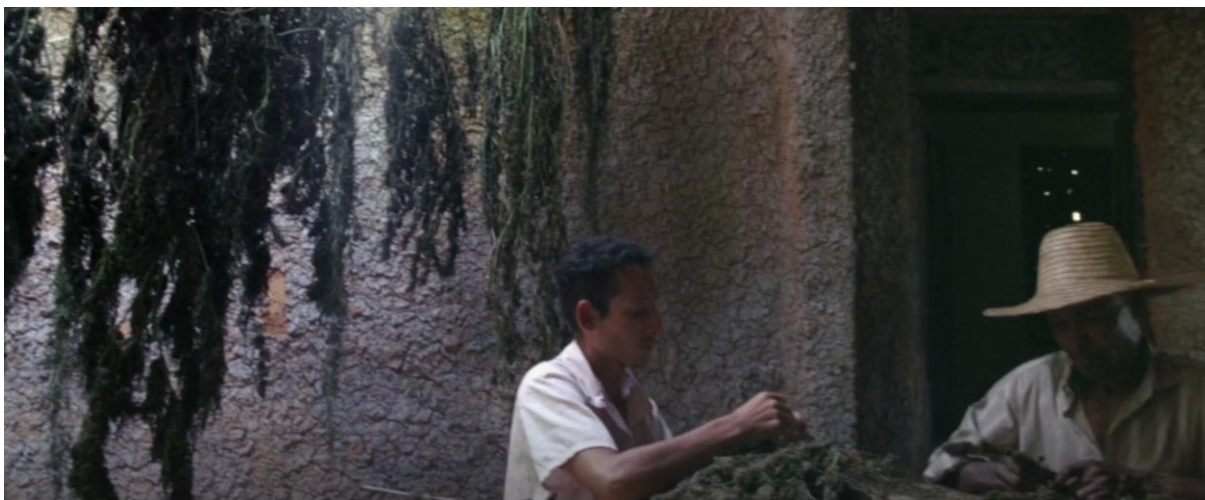
Figura 10. Desmoñe de marihuana. Guerra y Gallego (2018, 0:26:56).

En el largometraje se puede ver este proceso durante una escena, en la cual se realizan referencias al lugar en el que se llevaba a cabo la siembra y recolección (ranchos) y a los diferentes momentos de la producción de marihuana.