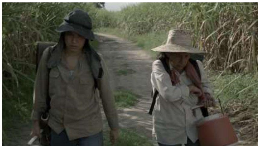
Figura 3. Vestuario de trabajo

En algunas ocasiones con personajes como Alicia y Esperanza, se evidencia en su ropa de trabajo la textura dura y con manchas de ceniza de pies a cabeza; esto también genera un cambio significativo en cuanto a la transformación de estos dos personajes, ya que hay un contraste entre la presentación durante el tiempo de trabajo, donde usan vestidos de tonalidades oscuras y descoloridas (Figura 3), y el tiempo en casa, donde su aspecto cambia por el uso de colores más vibrantes y frescos en sus vestiduras (Figura 4), sin dejar los colores y texturas que las caracterizan en el inicio.