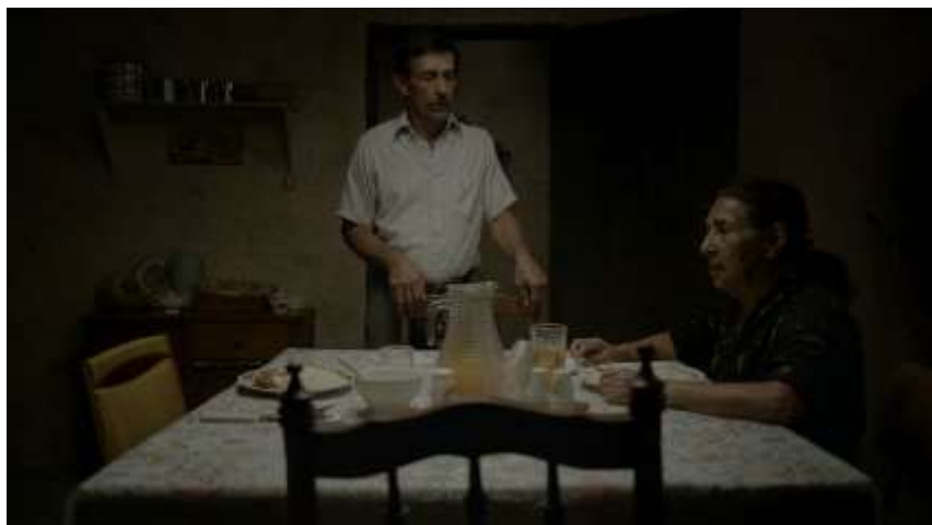
Figura 2. Paleta de color de los personajes principales