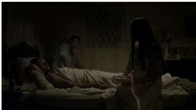
Figura 12. Presentación de personajes

amplitud en el momento de realizar acciones, con planos incómodos que ofrecen la sensación de encierro; de igual manera, se maneja una luz tenue y suave, sin fuerza como lo está el ánimo de Esperanza, Gerardo, Alicia y Manuel (Figura 12).