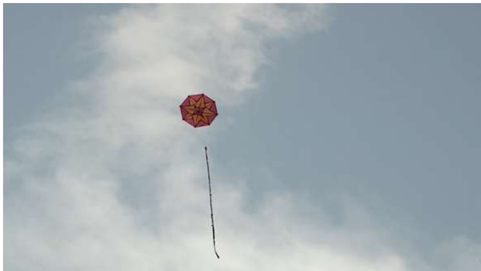
Figura 27. Cometa en el aire que despide a Gerardo