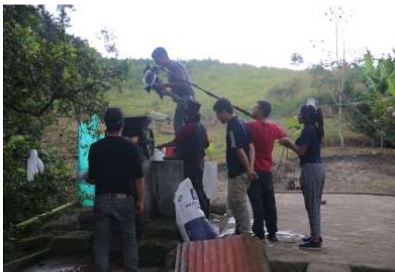
Figura 30. Rodaje del cortometraje “Detrás de las Montañas”

Nota: Con la familia Garzón Chivará (2017)