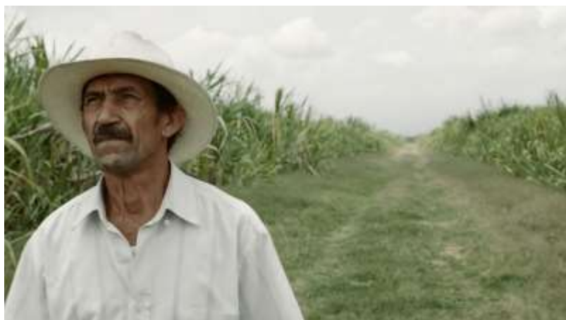
Figura 6. Vestuario de Gerardo

Alfonso se caracteriza por vestir camisas claras, pantalones y zapatos desgastados, además del uso de sombrero (Figura 6); este personaje denota un poco más de fuerza, el blanco en su vestuario podría decirse que hace alusión a la libertad y al desarraigo que él siente hacia su tierra; por otro lado, el aspecto de los zapatos puede reflejar el largo trayecto recorrido desde la salida de su lugar de origen. El sombrero que usa estando fuera de su casa, ya sea caminando en medio de los cañaduzales, en el pueblo, hospitales u otro lugar, muestra el carácter fuerte del personaje y la representación del campo.