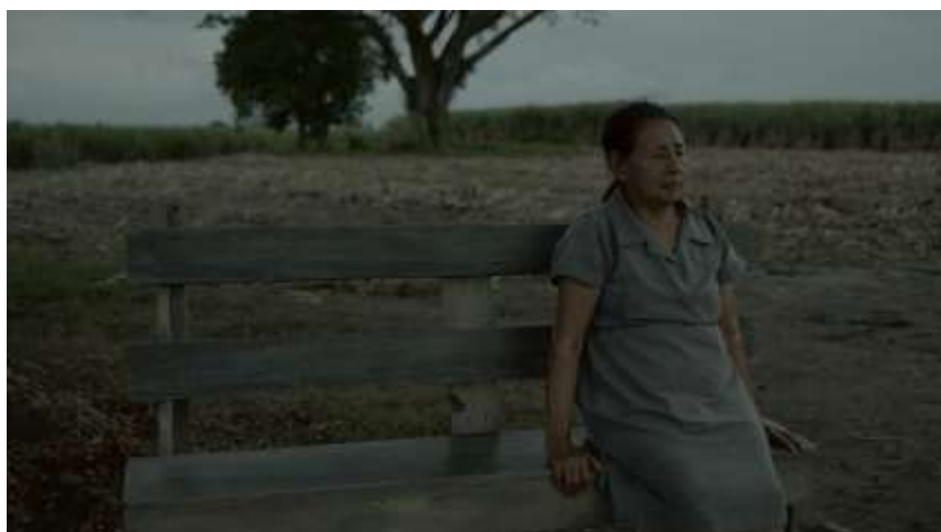
Figura 20. Alicia se queda sola