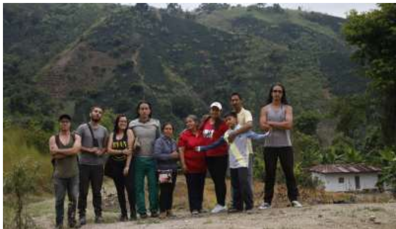
Figura 29. Preparando la locación antes del rodaje

Nota: Con la familia Garzón Chivará (2017)