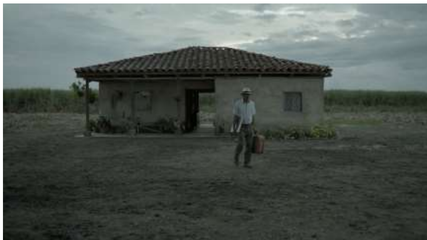
Figura 8. Exterior de la casa

El aspecto general de la casa en la parte exterior es igualmente oscuro, su color es gris y solo unas cuantas plantas dan esperanza de algo bueno por suceder (Figura 8); Sin embargo, se encuentra un árbol donde se posan los pájaros, algo muy importante en la construcción de la cinta que más adelante vamos a analizar en cuanto a la misión simbólica de los objetos.