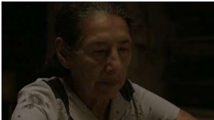
Figura 4. Vestuario en la casa