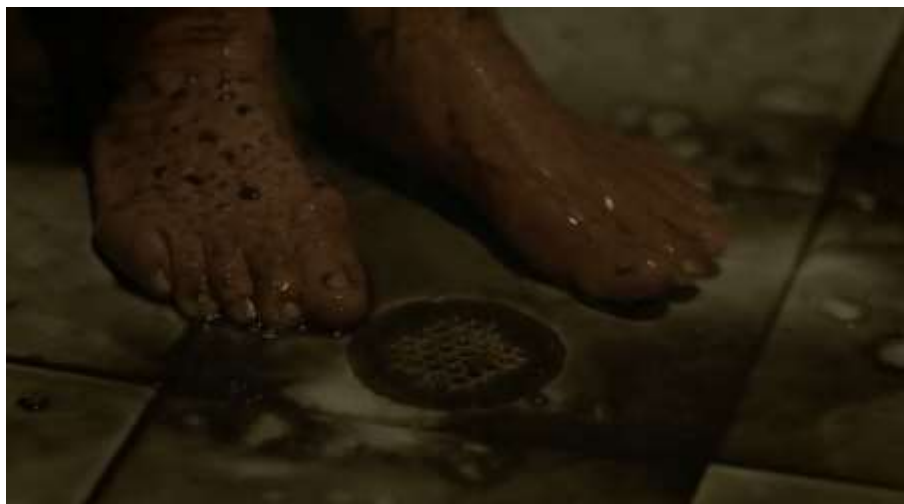
Figura 14. Pies de Alicia