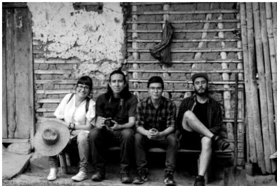
Figura 3. Integrantes del equipo del trabajo de grado