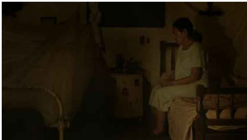
Figura 7. Habitación de Alicia