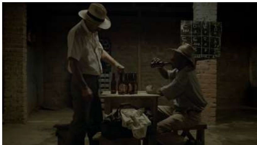
Figura 17. Escena del bar

Gerardo al hospital, durante el trayecto en carreta, él va cubierto completamente con una sábana, mientras planos cerrados se mueven. Adicionalmente, la escena del bar (Figura 17) ya previamente descrita, tiene una transición de luz y contrastes que reflejan el estado anímico de Alfonso.