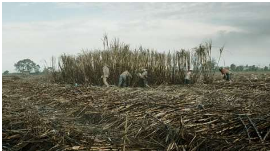
Figura 24. Cañaduzales siendo trabajados