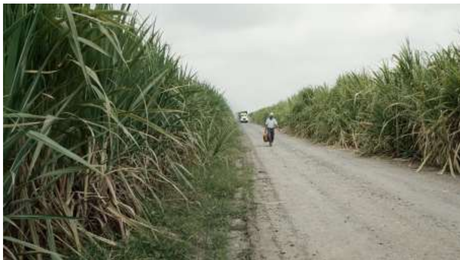
Figura 10. Plano inicial de la película