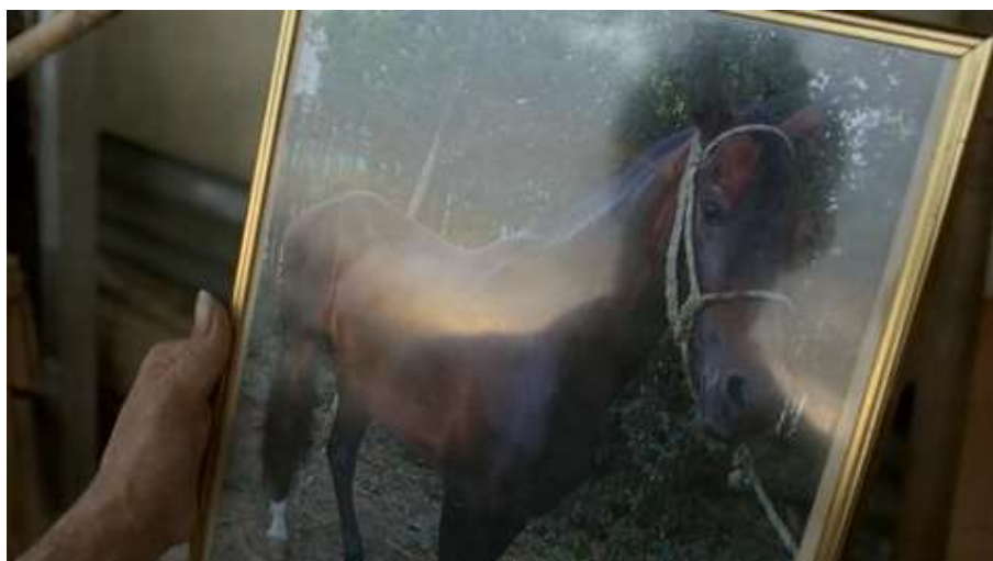
Figura 23. Retrato del caballo del sueño