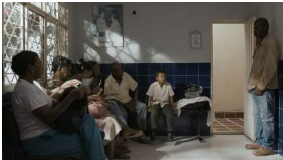
Figura 9. Hospital del pueblo

hijo de Alfonso, intenta mejorar su estado de salud sin conseguirlo, por falta de atención médica, instalaciones y recursos.