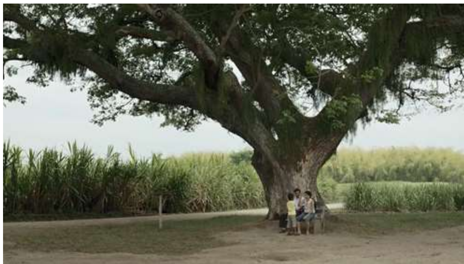
Figura 26. Árbol fuera de la casa

El árbol que se encuentra frente a la casa, representa cobertura, unión para la familia, allí encuentran paz, pueden compartir una buena conversación y hasta reír. Es una planta que es arraigada a la tierra y crece desmesuradamente en dirección al cielo, dando esperanza, soportando fuertes vientos y temperaturas cambiantes. Vive por muchos años, lo que simboliza estabilidad y sabiduría; al escuchar el murmullo de sus hojas por el viento, expresa calma, tranquilidad y paz (figura 26).