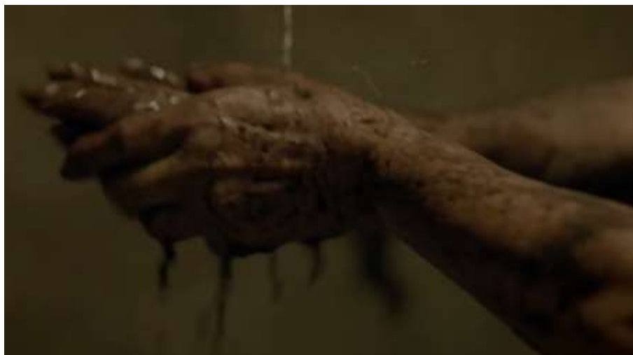
Figura 13. Manos de Alicia