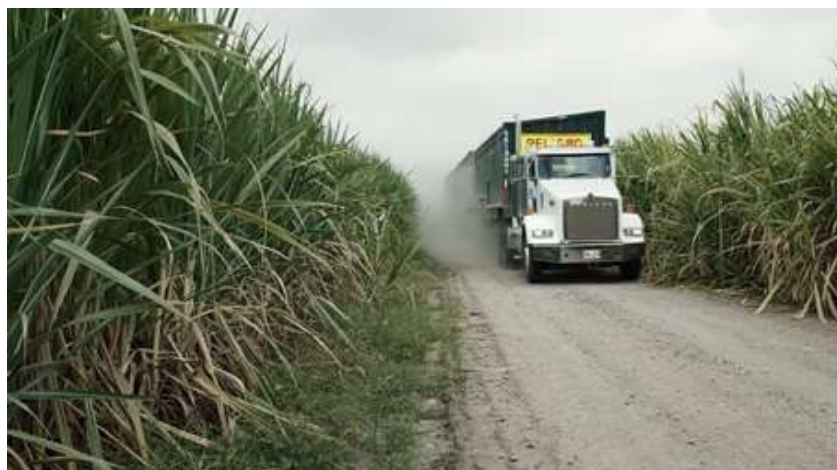
Figura 21. Camión que advierte el peligro

La Misión simbólica de los objetos se definirá con las imágenes representativas de cada uno de los elementos que tiene un propósito en la historia, partiendo del ya nombrado primer plano. En primer lugar, el camión que pasa sobre la vía tiene un letrero que dice peligro, advirtiendo de su contenido, ya que transporta las sobras de los cañaduzales quemados y representa la entrada de la industrialización al campo, que si bien podría ser benéfico, también contamina y aturde con el sonido emitido. (Figura 21)