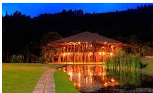
Anexo G. Caso Pijao.