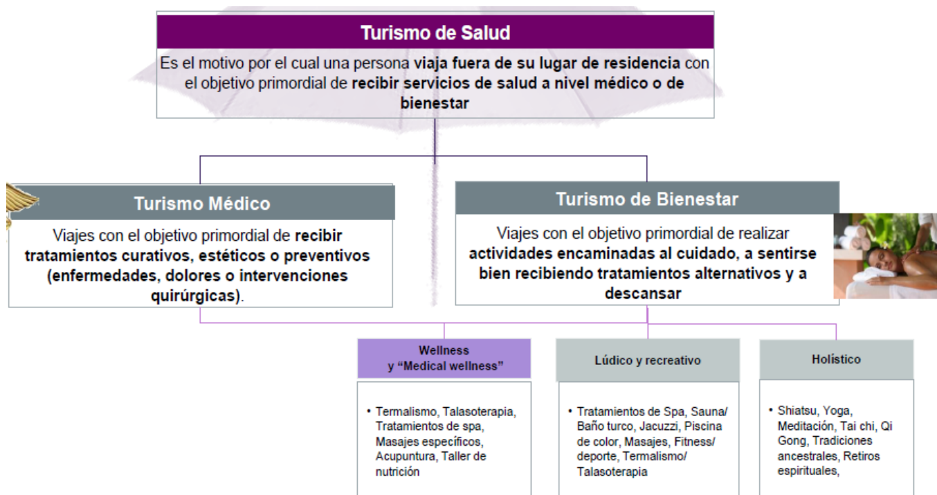
Figura 2. Clasificación turismo de bienestar. Tomada del Plan de negocios para el subsector del turismo de bienestar 2013, Colombia productiva (2013).

El turismo de bienestar se enfoca en tratamientos de alternativos y terapeuticos, como subsector del turismo de salud y Colombia tiene la oportunidad de atraer turistas tanto nacionales como internacionales por la tendencia de autocuidado y estilos de vida saludable; la visión que tiene el país al año 2032 según Colombia productiva es que el turismo de bienestar se convierta en uno de los motores del desarrollo social y económico en las diferentes regiones que cuentan con el potencial para poder hacerlo (Colombia productiva, 2020).