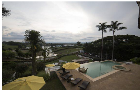
Anexo F. Recinto del pensamiento.