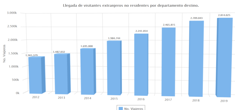
Figura 3. Llegada viajeros extranjeros a Colombia. Adaptada con datos de Migración Colombia (2020-06) CiTur (2020).

Así mismo, se puede validar el crecimiento del turismo en general en el país, de acuerdo a las estadísticas del Centro de información Turística de Colombia.