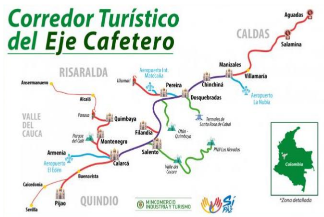
Figura 1. Mapa Eje cafetero. MinCit (2020).

El eje cafetero se ubica en el centro occidente de Colombia integra 47 municipios de los departamentos de Caldas, Quindío, Risaralda y Valle del Cauca. En ese sentido, algunos municipios que hacen parte son Chinchiná, Villamaría, Palestina, Neira, Cartago, La Virginia, Dosquebradas, Santa Rosa de Cabal, Calarcá, Circasia, La Tebaida, Pijao, Salento, Filandia, Montenegro y otros (Gaviria, 2019).