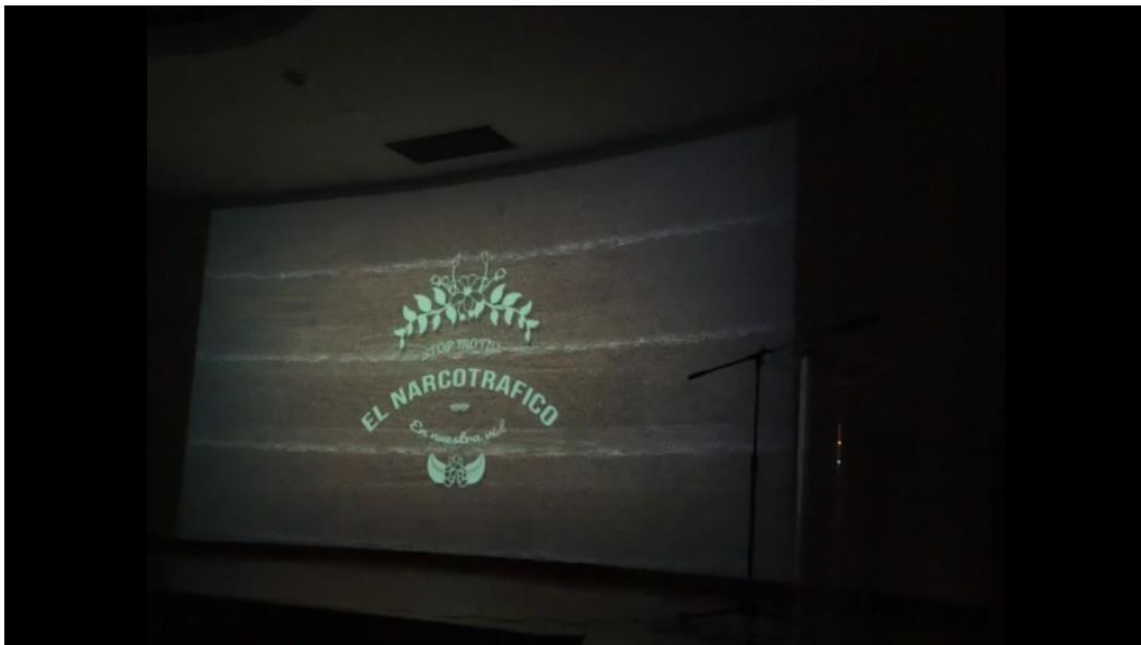
Figura 17.Muestra Audiovisual 3.