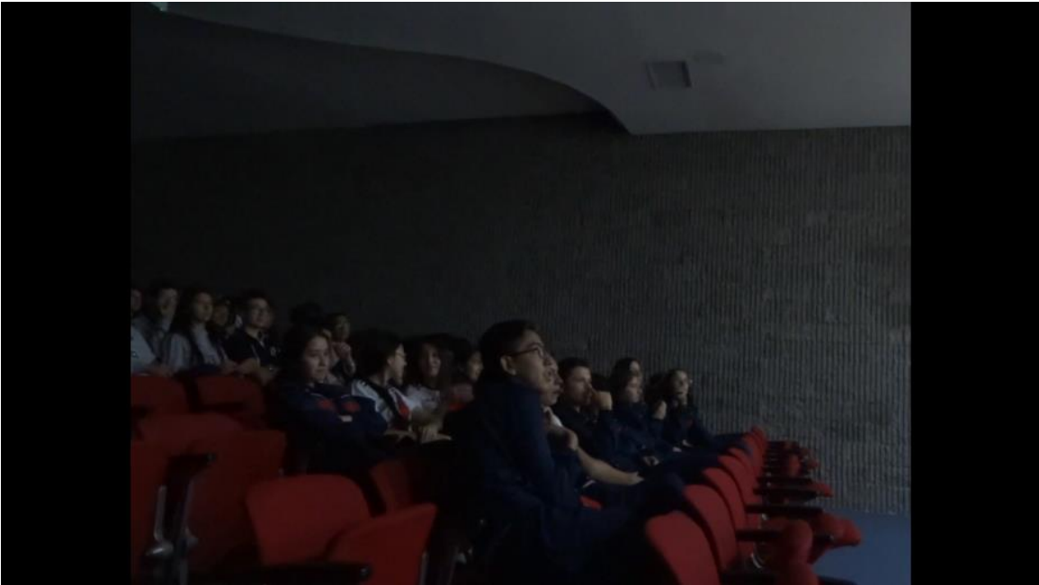
Figura 16.Muestra Audiovisual 2.