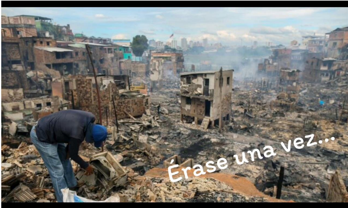
Figura 12. Introducción cortometraje 1. Cortometraje "Cartel de las baby's".