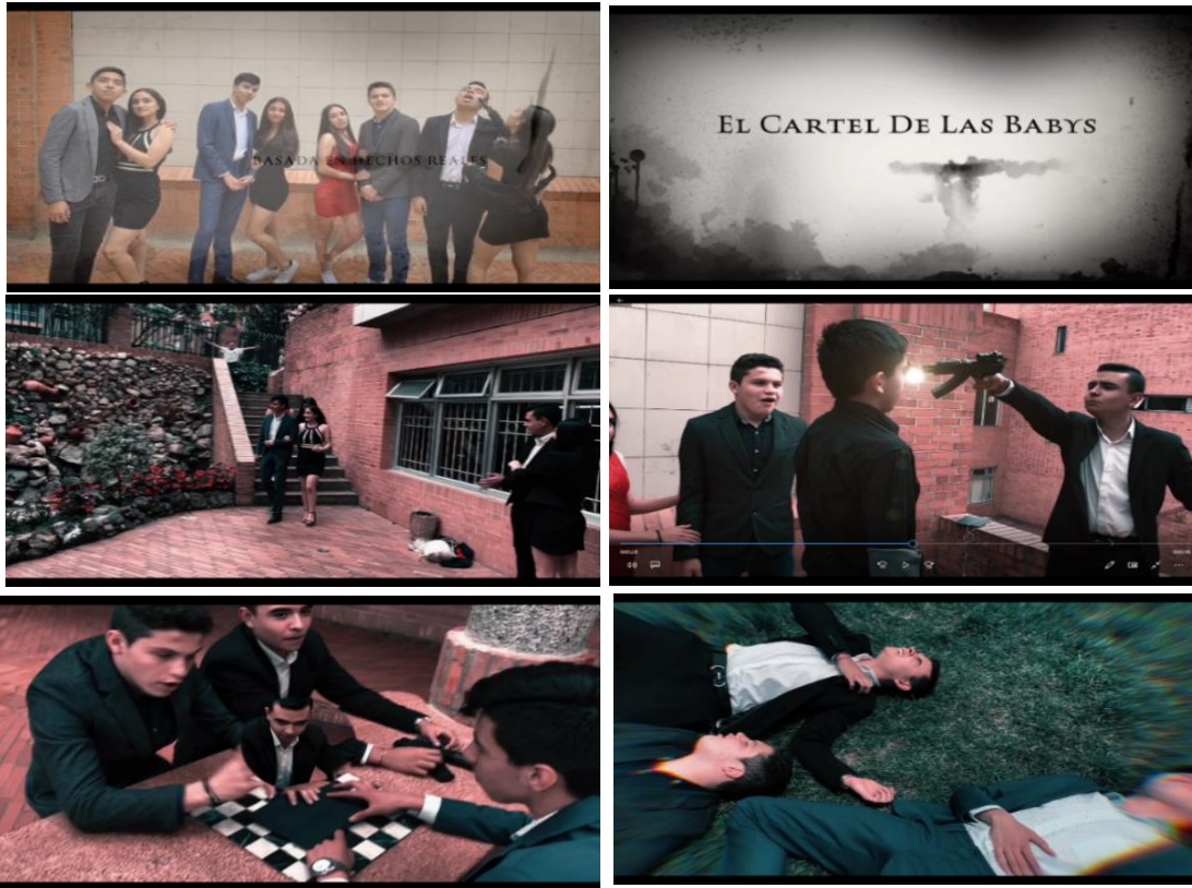
Figura 14. Capturas. Cortometraje "Cartel de las baby's".