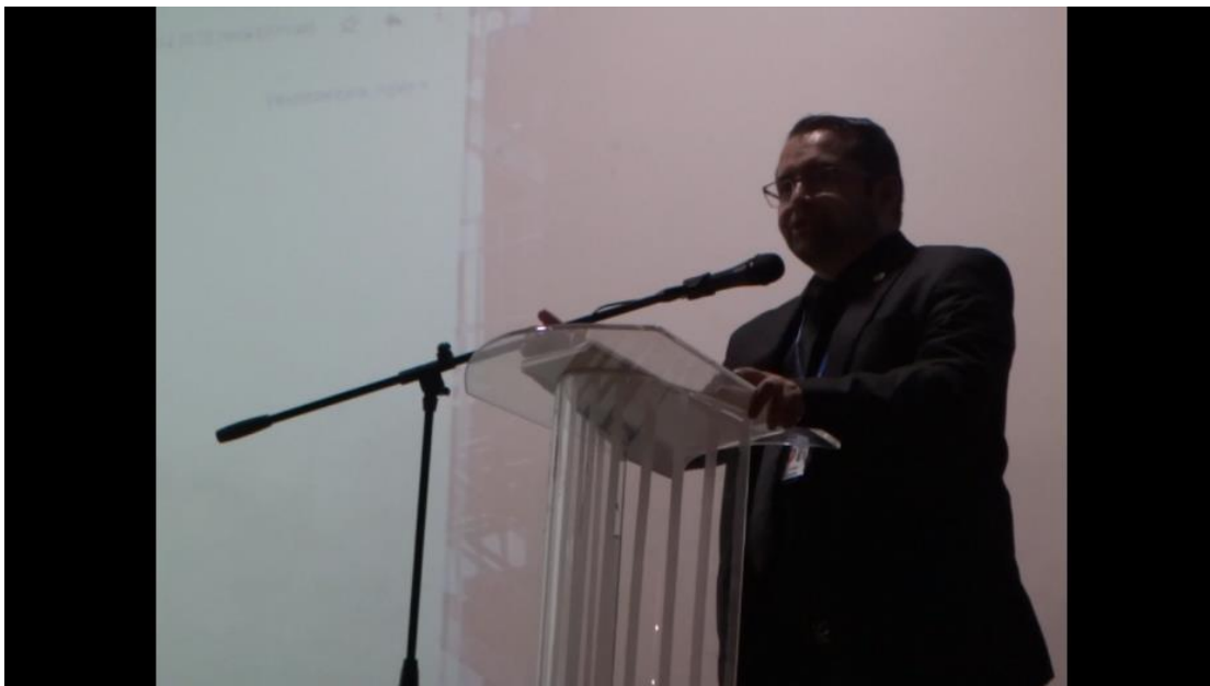
Figura 15. Muestra Audiovisual1.