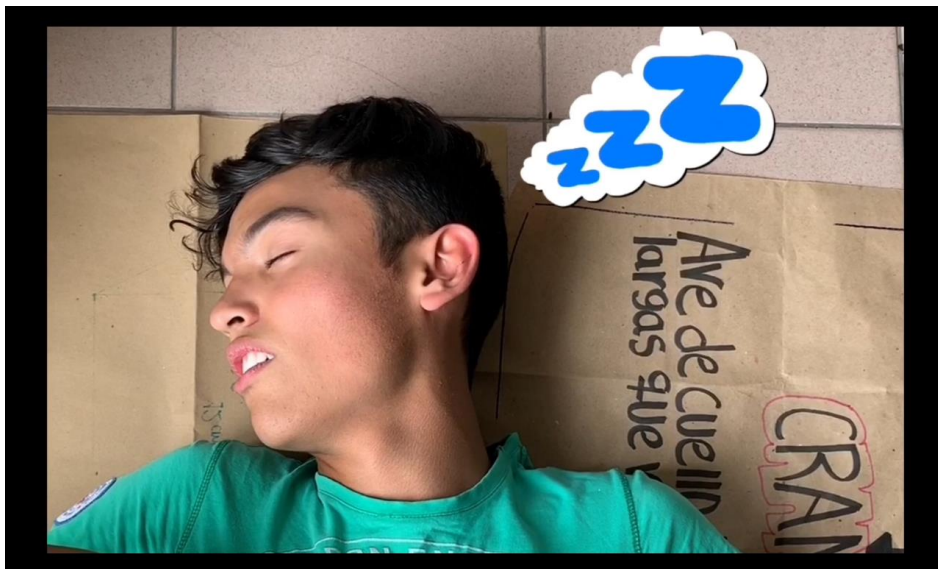
Figura 13. Introducción cortometraje 2. Cortometraje "Cartel de las baby's".