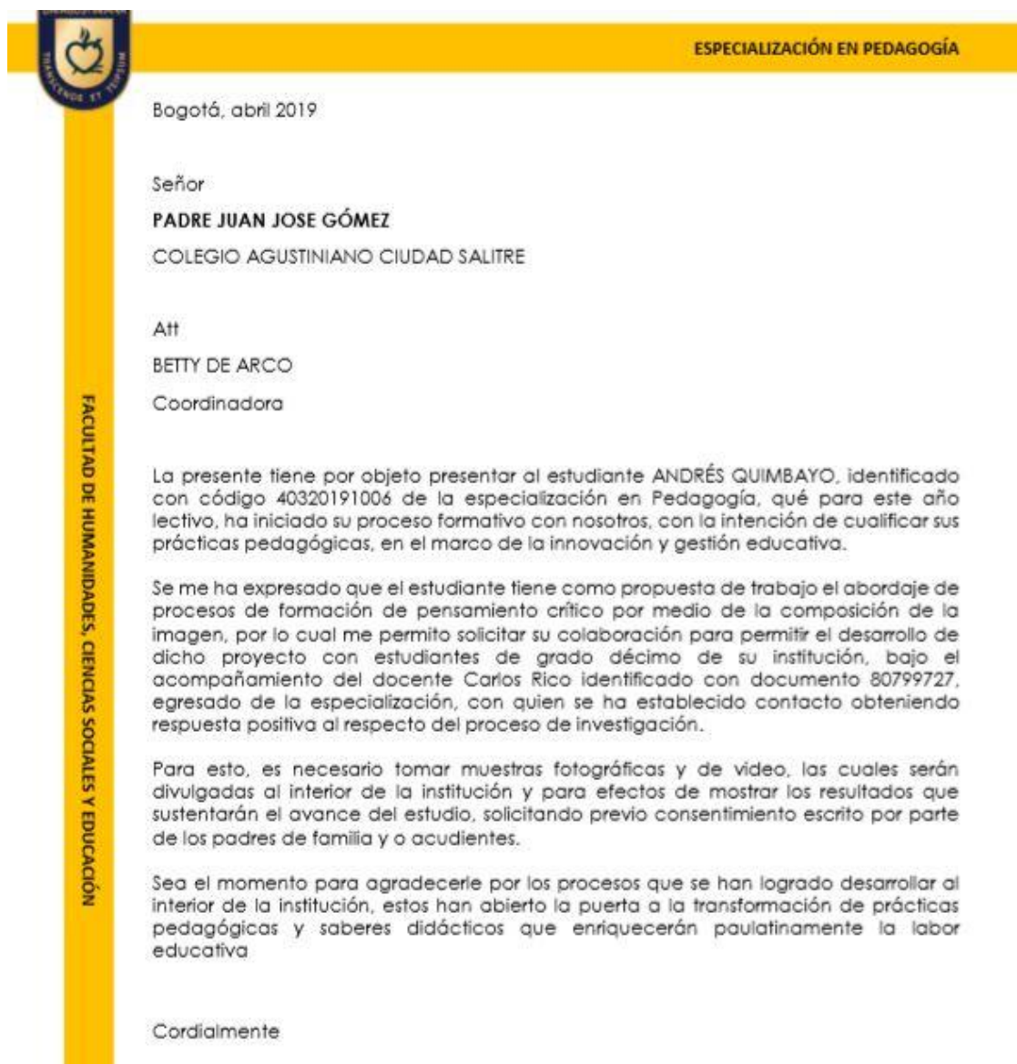
Figura 3. Autorización. Facultad de humanidades, ciencias sociales y educación.