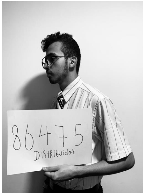
Figura 8. Fotografía 10-A.