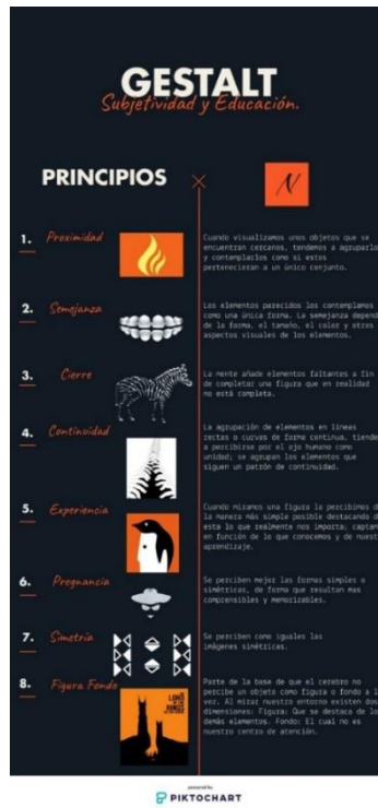
Figura 10. Herramienta de trabajo2.