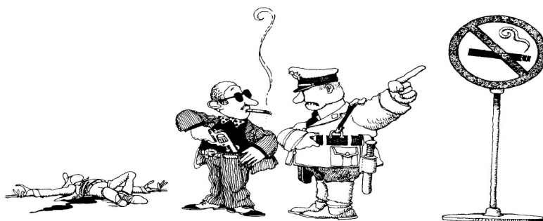
Figura 1. Prohibido fumar. Quino (2007)