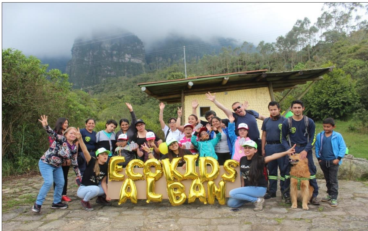
Figura 111. Fotografía grupal fin de la actividad