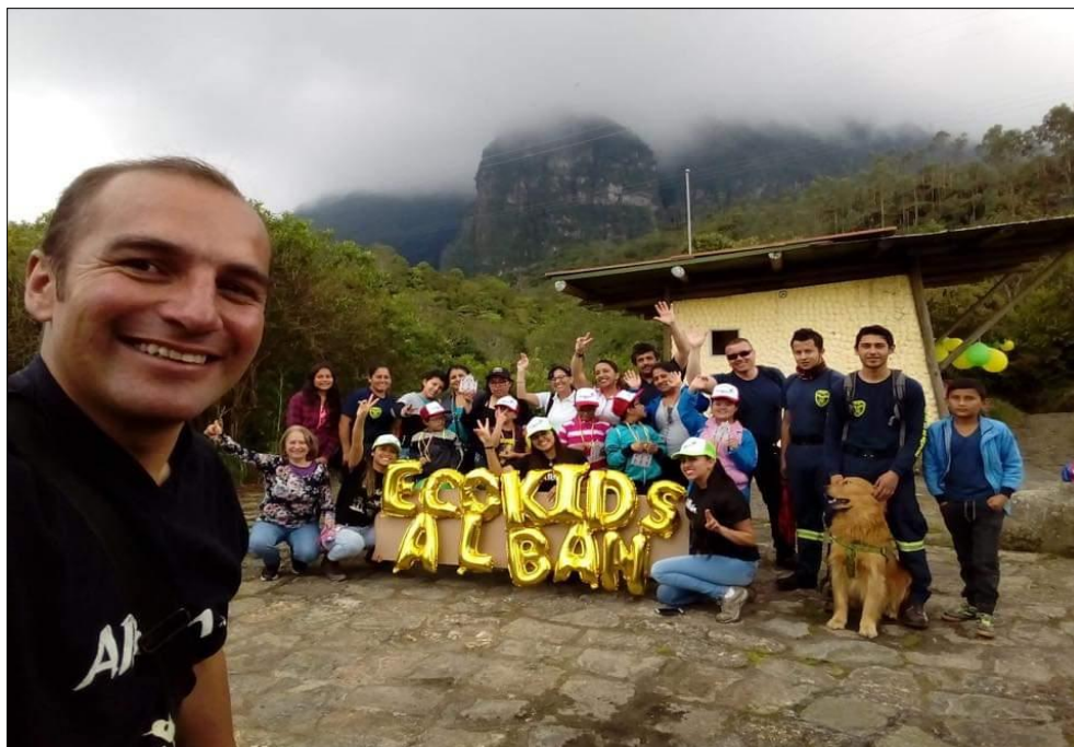
Figura 110. Fotografía grupal fin de la actividad