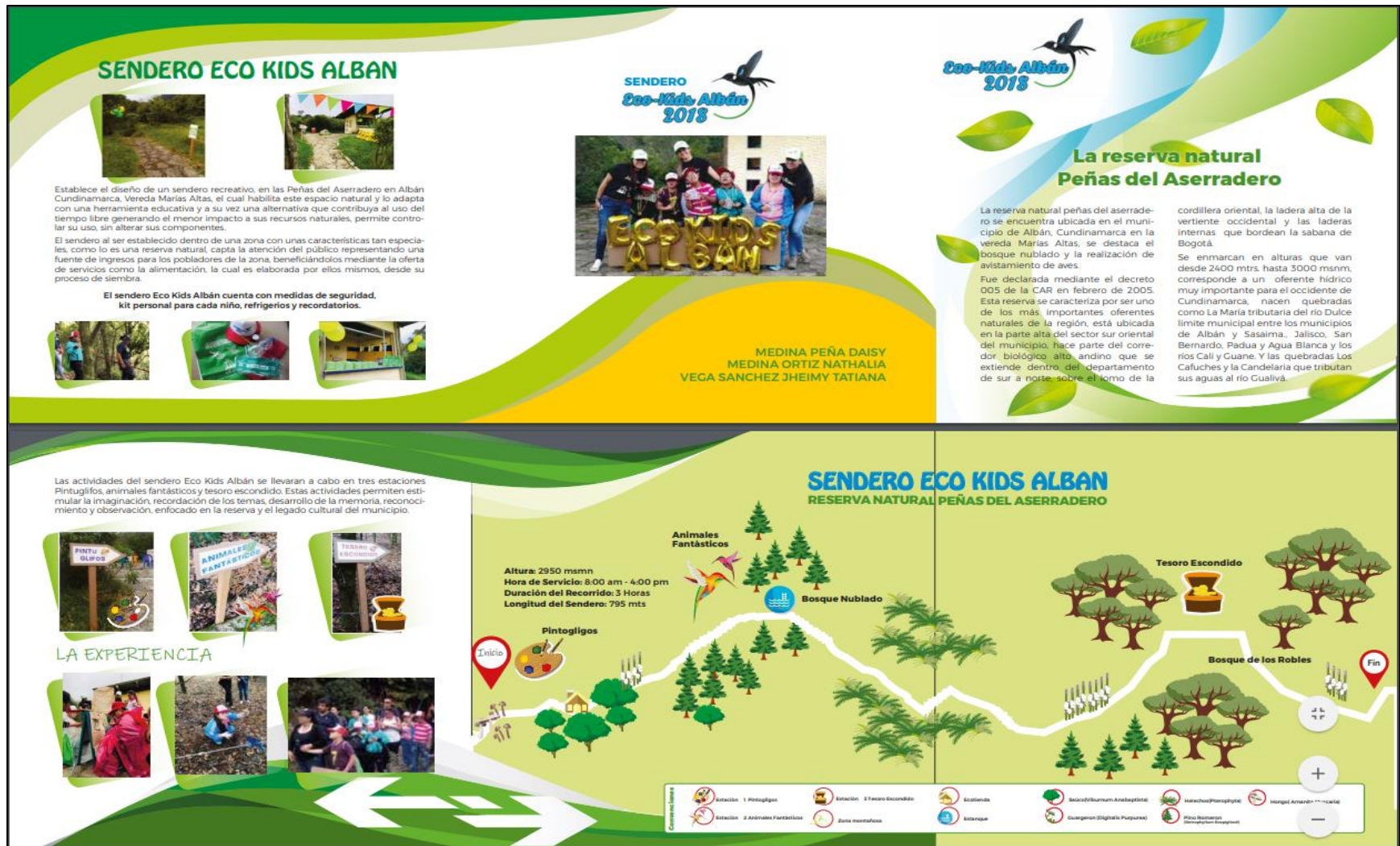
Figura 112. Brochure Sendero Eco Kids Albán 2018 – Elaboración propia