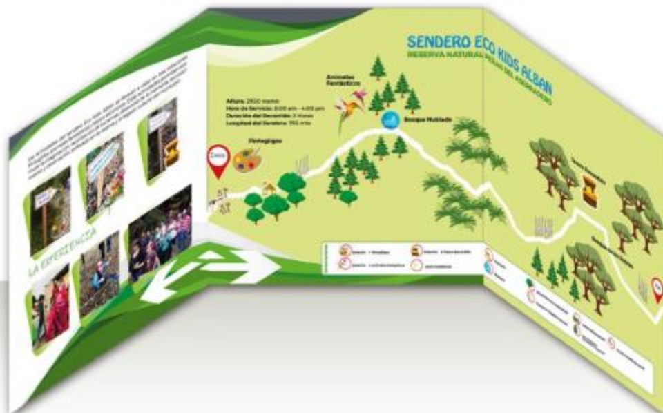
Figura 113. Vista 3D Brochure Sendero Eco Kids Albán 2018 – Elaboración propia