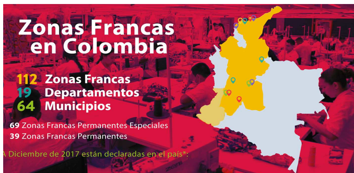
Figura 2. Zonas Francas en Colombia. Cámara de usuarios de Zonas Francas de la ANDI

Como se observa en la figura 2 los principales departamentos en donde se encuentran ubicadas.