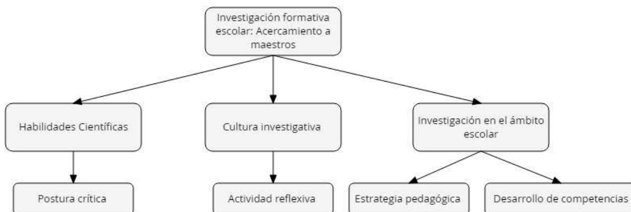
Figura 1 Categorías y subcategorías de la investigación.

Dentro de las preguntas resueltas en el cuestionario por cada uno de los docentes involucrados, se generan varias subcategorías resultado de las categorías seleccionadas en un primer momento, y que se manifiestan a continuación: