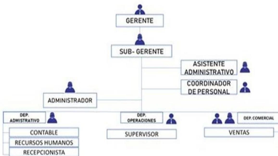
Figura 1. Estructura organizacional. Autoría propia.

Actualmente la empresa cuenta con una estructura organizacional vertical, lo que permite identificar la existencia de un nivel estratégico donde el gerente es quien toma las decisiones sobre las demás áreas, Asigna tareas, y atiende contingencias; dentro de este nivel también se encuentra el Sub-gerente quién reemplaza al gerente cuando se encuentra en ausencia en diferentes actividades, brinda al trabajador los instrumentos adecuados necesarios para la realización de sus funciones, ofrece incentivos para el buen desempeño de las labores de cada uno de los empleados, mantiene una excelente comunicación con los clientes y proveedores.