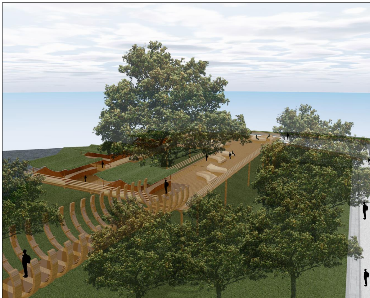
Figura 37. Perspectiva plazas propuestas. Autoría propia (2020)