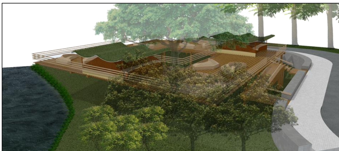
Figura 38. Perspectiva plazas propuestas. Autoría propia (2020)