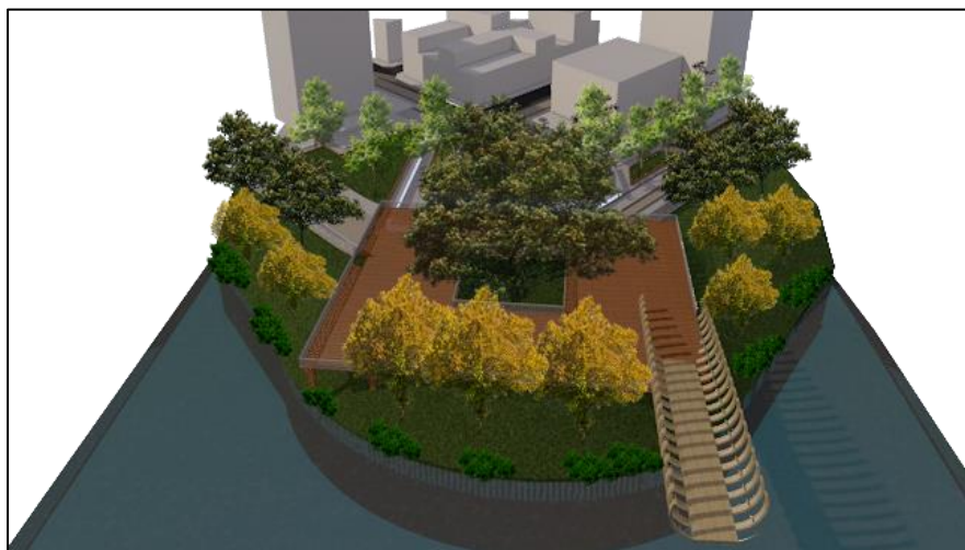
Figura 41. perspectiva plazas propuestas. Autoría propia (2020)