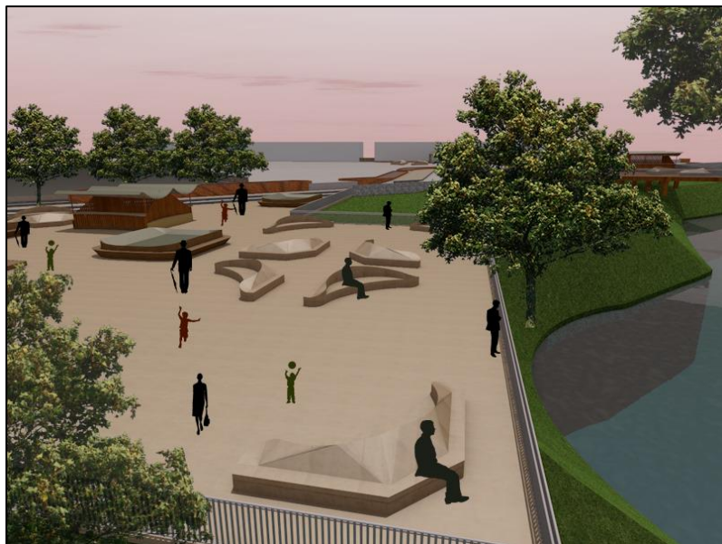
Figura 42. plazas propuestas. Autoría propia (2020)