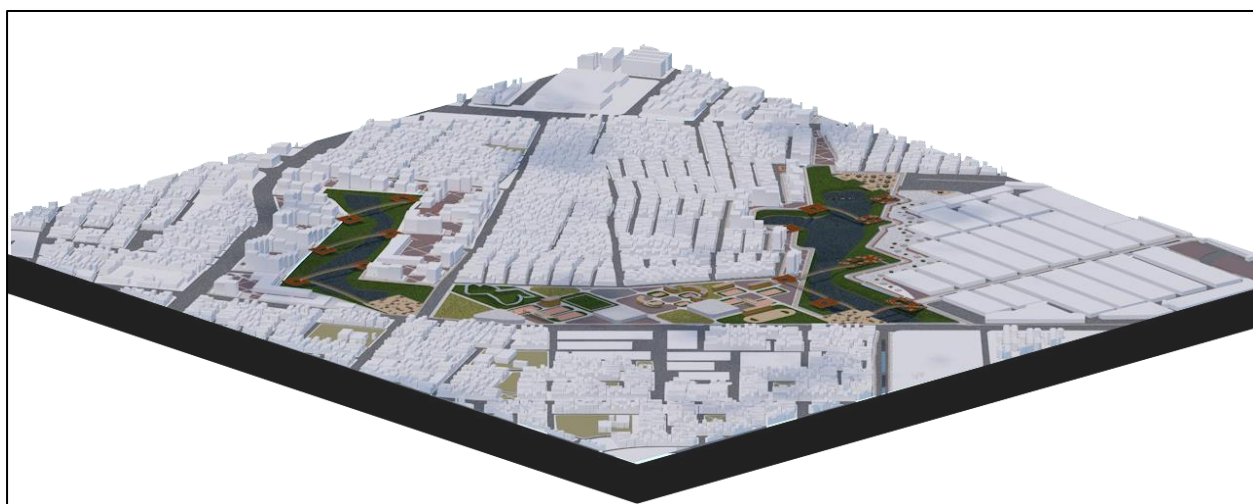
Figura 43. perspectiva proyecto general. Autoría propia (2020)