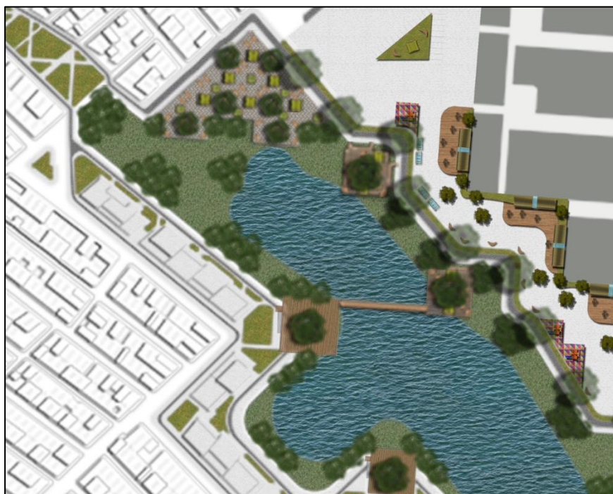
Figura 36. Planta zoom 2. Autoría propia (2020)