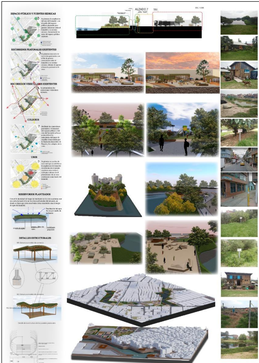
Figura 47. panel 3 entrega final proyecto de grado. Autoría propia (2020)