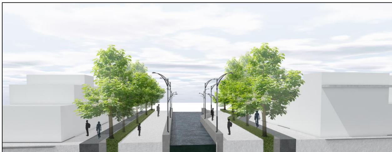
Figura 39. conexiones propuestas, senderos peatonales. Autoría propia (2020)