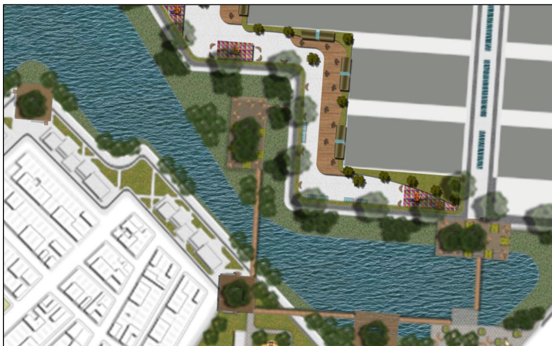
Figura 35. Planta zoom 1. Autoría propia (2020)