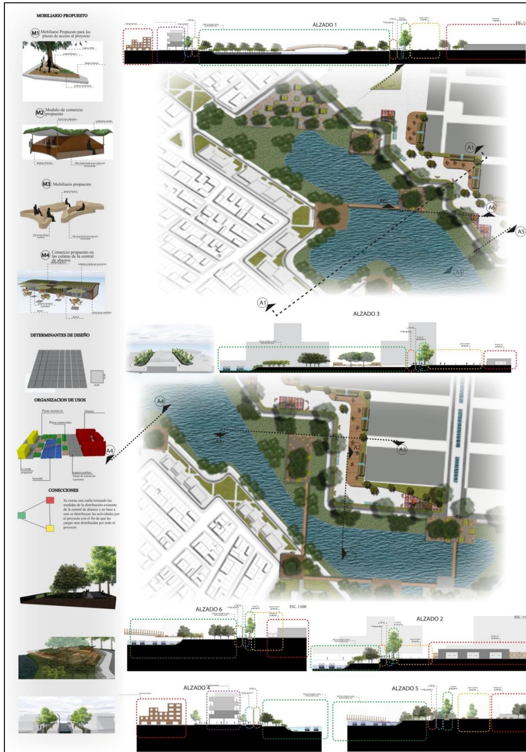
Figura 46. panel 2 entrega final proyecto de grado.