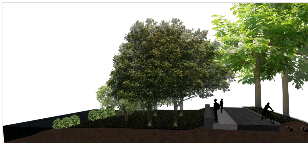
Figura 40. sendero peatonal del lindero del humedal zona norte. Autoría propia (2020)