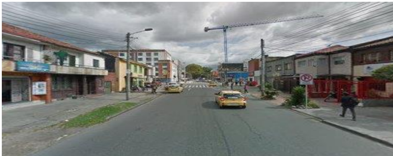
Figura 1. Localización geográfica Ingsumitec. Google maps (2019)

El Sector empresarial al que pertenece es terciario o de servicios, tecnologías de la información y telecomunicaciones (TICS), servicios comprendido en el código CIU 6202